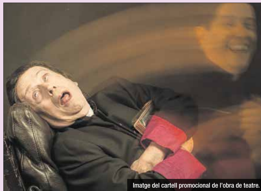
Imatge del cartell promocional de l'obra de teatre.