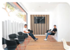
nueva sala de espera

MÁS BOXES, UN ESPACIO ESPECIAL PARA LOS PEQUEÑOS Y UNA SALA DE ESPERA MÁS AMPLIA. CONFORT Y CUIDADO EN CADA DETALLE.