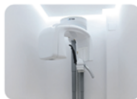
TAC 3D + ortopantomógrafo