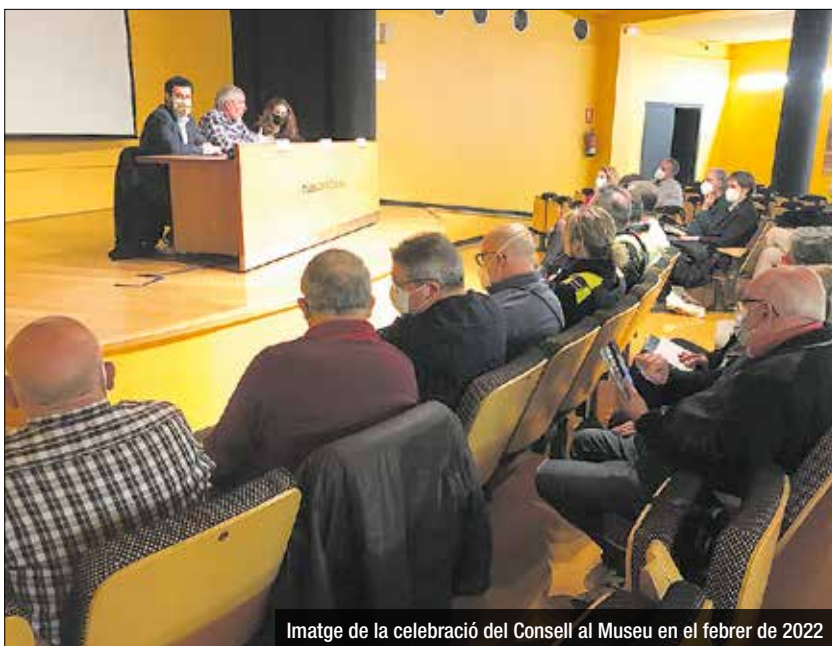
Imatge de la celebració del Consell al Museu en el febrer de 2022

La insistència de la FAVB i els episodis d'incivisme i delictius viscuts a la ciutat darrerament sumen pressió perquè la convocatòria del Consell Municipal de Prevenció i Seguretat estigui més a prop. Fonts consultades apunten que s'està intentant tancar la data del 17 de setembre per a la seva celebració. Si més no, només en el recompte global de 26 vehicles cremats en el Barcelonès des del 25 d'agost, 14 corresponen a Badalona, 9 a l'Hospitalet i 3 a Sant Adrià, segons dades dels Bombers. L'ens és una iniciativa que la FAVB posa sobre la taula l'any 2016, espai transversal i de consens que defineix un model de seguretat basat en la proximitat, la reeducació, la lluita contra la desigualtat i el control democràtic de la ciutadania. No va ser fins el juliol de 2019 quan el govern d'Àlex Pastor aprova