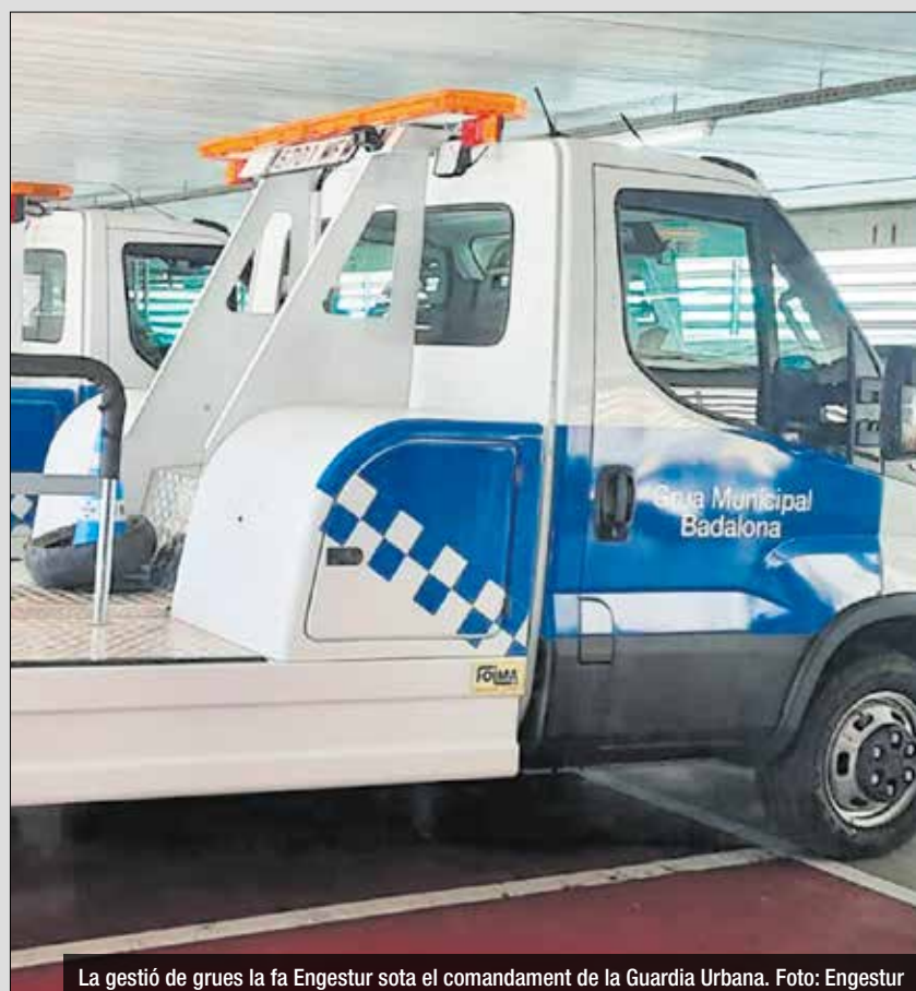
La gestió de grues la fa Engestur sota el comandament de la Guàrdia Urbana.