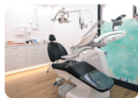
3 boxes nuevos