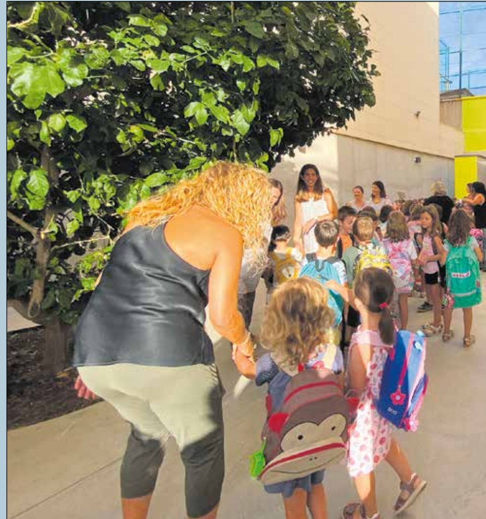
Les trobades després de l'estiu són ben celebrades durant les primeres jornades del nou curs.

Aquests dos centres tenen assignats cadascú una partida de 5,8 milions d'euros per part de la Generalitat de Catalunya, a distri-