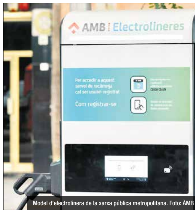
Model d'electrolinera de la xarxa pública metropolitana.

El foment segur dels desplaçaments en bicicleta, si més no com a opció intermodal, s'ha vogut reforçar amb la creació de 290 places extres d'aparcaments del servei AMBici a 14 punts, d'entre els quals 4 es troben a Badalona (a les platges del Coco, de la Mora, del Pont d'en Botifarreta) i a l'estació RENFE Badalona. Aquesta campanya forma part de "+P d'últim quilòmetre", "ñies a dir, connecten amb altres serveis com rodalies o tram i estacions de platja.