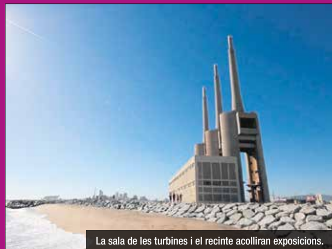
La sala de les turbines i el recinte acolliran exposicions.

preu general és de 15 euros per a tota la durada del Festival, amb descomptes que van del 30% al 50% per a diferents col·lectius. L'accés per als menors de 18 anys és gratuït. Ja es poden adquirir en el portal de l'esdeveniment: https://manifesta15.org