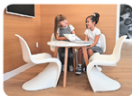
nueva zona infantil