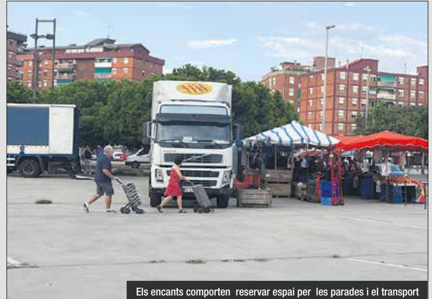
Els encants comporten reservar espai per les parades i el transport