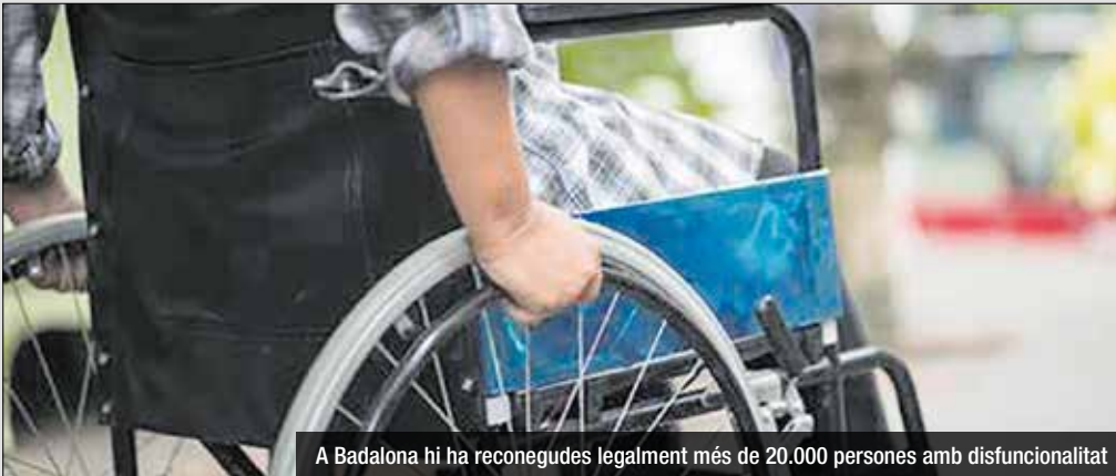
A Badalona hi ha reconegudes legalment més de 20.000 persones amb disfuncionalitat

El darrer aprovat a la ciutat data del 2012