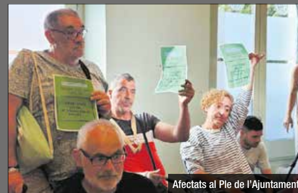
Afectats al Ple de l'Ajuntament

Els afectats pel tancament de Can Bofí Vell ja fa prop d'un mes que dormen a la Plaça de la Vila de Badalona. El polèmic tancament de l'alberg social va provocar que la quarantena de persones que hi feien nit s'hagin vist obligades a trobar altres espais. Molts dels antics usuaris continuen dormint al carrer sense cap alternativa. Alguns dels acampats han buscat maneres de visibilitzar la seva situació i van assistir al darrer Ple