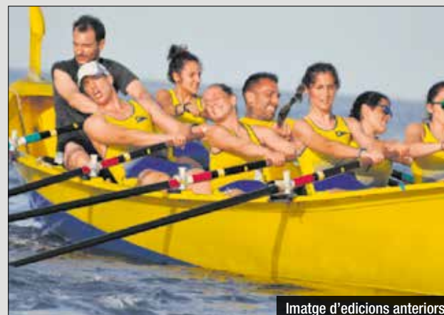
Imatge d'edicions anteriors

Aquest dissabte 8 de juny té lloc la 18a edició del Trofeu Ciutat de Badalona de Llagut, més conegut com La llarga que, com cada any, organitza el Club Nàutic Bètulo. La sortida serà a les 10 del matí des de la seu del club, amb un recorregut de 4000 metres fins al Port de Badalona. Aquesta regata és un clàssic habitual a Badalona,