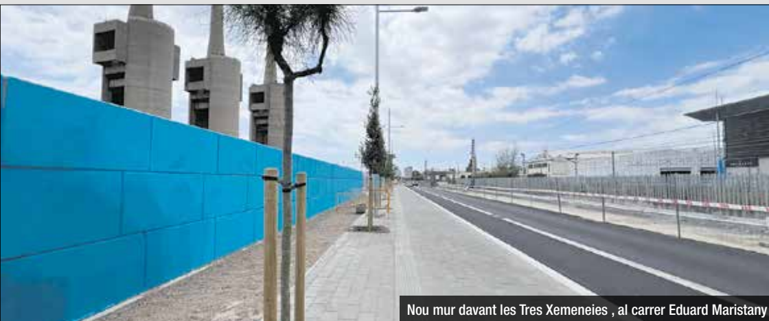
Nou mur davant les Tres Xemeneies, al carrer Eduard Maristany

Segons ha avançat el TOT, la setmana que ve acabaran les obres del mur d'Eduard Maristany acabarà la setmana que ve. Els treballs a càrrec de l'AMB s'han allargat més de 6 mesos i eren una demanda històrica dels veïns de la zona.