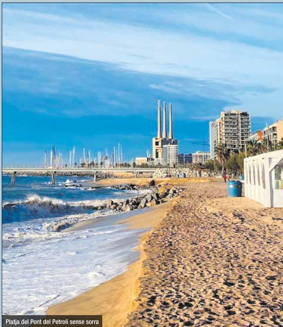
Platja del Pont del Petroli sense sorra

per a persones amb diversitat funcional. En guany només s'ofereix amb cadira amfíbia a la platja dels Pescadors (a l'altura del carrer de Mar). Des del govern s'ha justificat que només es pot donar en aquest lloc a causa de l'estat de les platges, per la falta de sorra i el desnivell existent en el trencant de les onades. La plataforma 'Deixem de Ser Invisibles' ha reclamat en diverses ocasions a l'Ajuntament de Badalona que millori aquest servei.