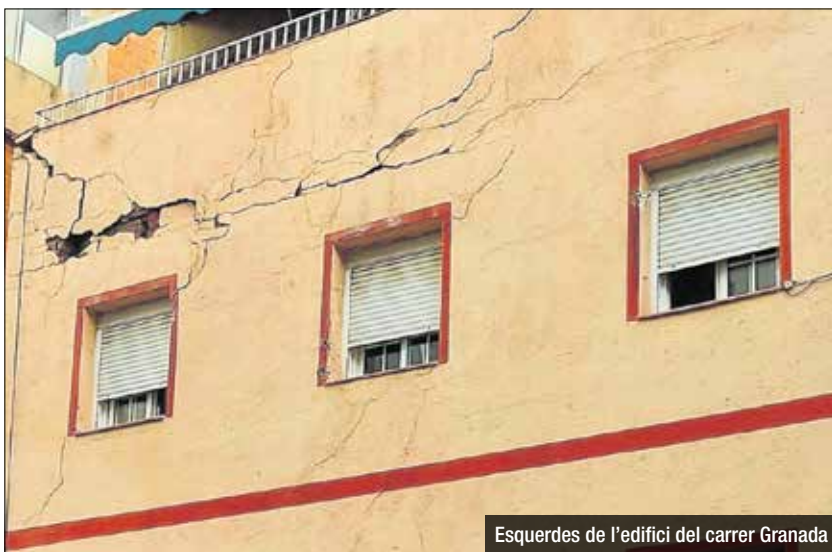
Esquerdas de l'edifici del carrer Granada

per a la seva millora i sanejament. D'altra banda, durant els pròxims dies també està previst descompactar el sòl d'alguns espais, en concret dels plataners al costat de la glorieta, el dels pins, els roures i els lledoners que hi ha davant de l'Escola Artur S' han realitzat una valoració de l'arbrat més afectat i han dut a terme proves de resistència a la caiguda, així com tasques de poda especial en alguns exemplars per a la seva millora i sanejament. D'altra banda, durant els pròxims dies també està previst descompactar el sòl d'alguns espais, en concret dels plataners al costat de la glorieta, el dels pins, els roures i els lledoners que hi ha davant de l'Escola Artur Martorell. Amb aquest treball s'aconseguirà una millor ventilació del sistema radicular de l'arbrat, així com una millora en la infiltració de l'aigua en el sòl.