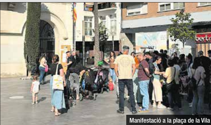
Manifestació a la plaça de la Vila

Reclamen al govern un sistema de climatització integral