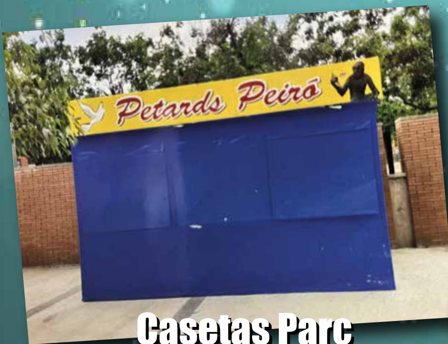
Casetas Parc del Molinet

La tienda de los petardos de Santa Coloma y Badalona!