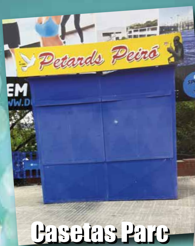
Casetas Parc de Can Zam