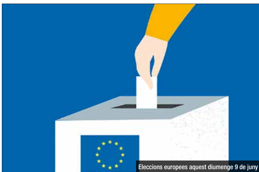
Eleccions europees aquest diumenge 9 de juny