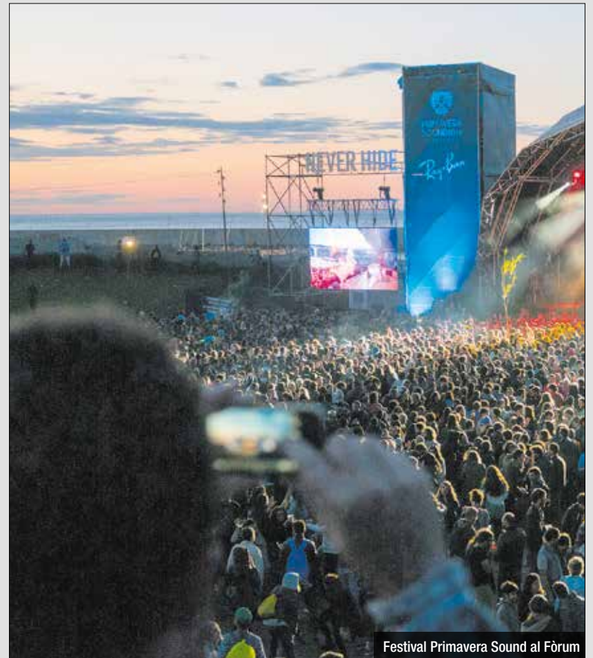
Festival Primavera Sound al Fòrum

No entenen, diuen, que hagin de sofrir les molèsties d'un festival que se celebra a Barcelona “quan ens trobem a més de 10 km de