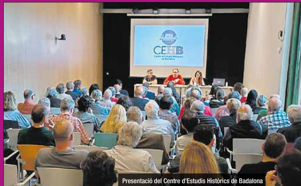
Presentació del Centre d'Estudis Històrics de Badalona

El CEHB ha de sumar a tot el que ja existeix a Badalona que, evidentment, ja es fa molt bona feina. Nosaltres entenem el Museu com a una entitat museística i, per tant, s'ha d'ocupar principalment del patrimoni que conserva a nivell inventari oferint un servei centrat en aquest àmbit museístic. Evidentment, tenen un equipament molt potent i fan una gran feina, però nosaltres hem d'entrar més en l'àmbit de fomentar que es facin més estudis a nivell històric.