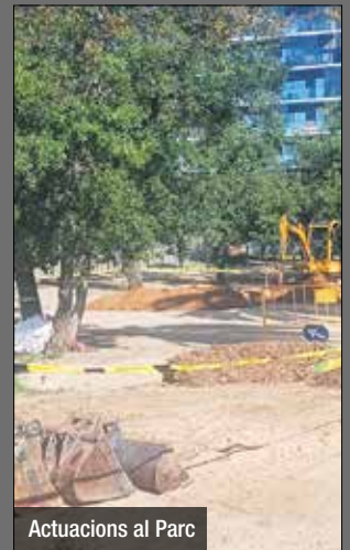
Actuacions al Parc

L'Ajuntament de Badalona i l'AMB porten a terme actuacions encaminades a la millora de l'estat de l'arbrat del parc de Can Solei i de Ca l'Arnús que ha patit les conseqüències de la sequera i garantir la seguretat dels usuaris d'aquest espai.