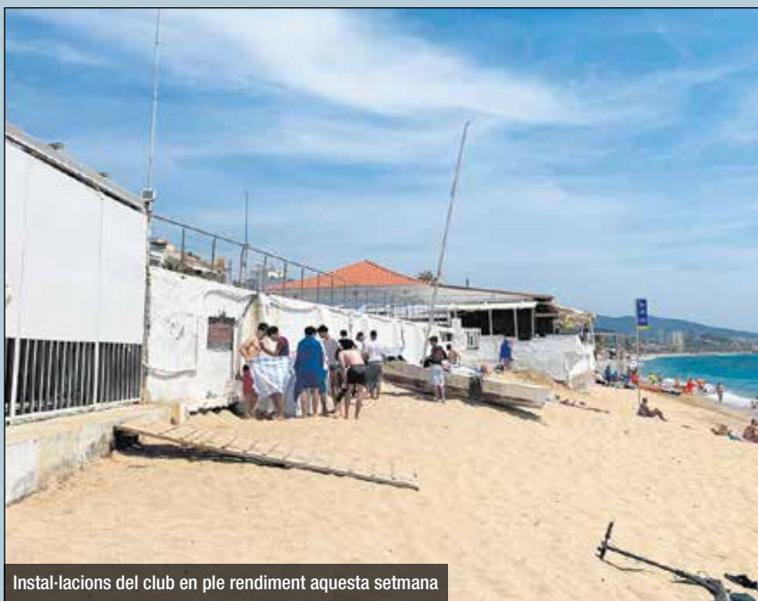
Instal·lacions del club en ple rendiment aquesta setmana

La falta de sorra no només genera canvis en el perfil de la costa. Un dels primers afectats van ser les guinguetes que es van instal·lar a la costa badalonina. Aquestes van haver de reubicar-se i algunes d'elles han acabat pràcticament trepitjant al Passeig Marítim. Un altre servei perjudicat és l'acompanyament a l'aigua