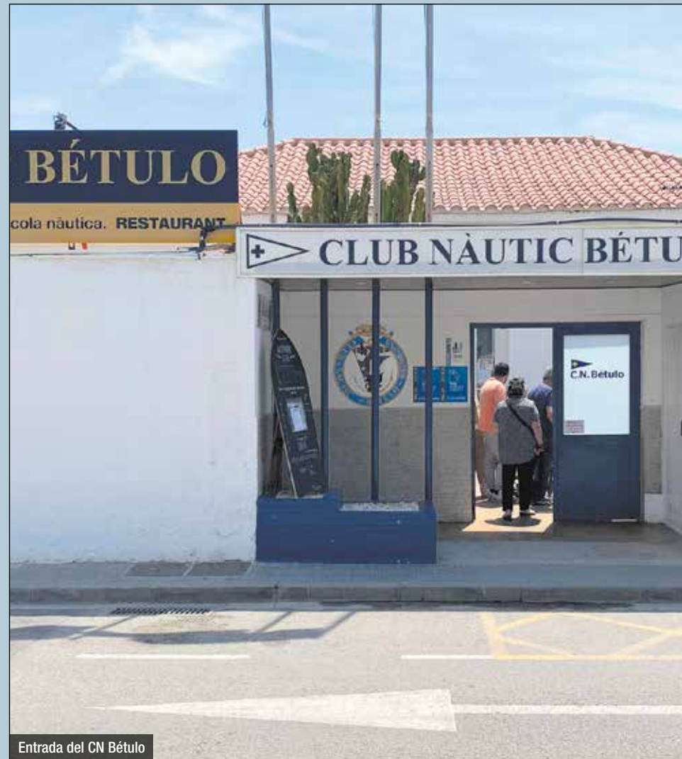
Entrada del CN Bétulo

El 2019, el Club Nàutic de Cabrera ja va ser un dels primers clubs de vela catalans en tancar les portes per aquesta llei. Una desena de clubs es veuen en una situació similar i l'Estat ja va declarar fa un parell d'anys la seva demolició. Aquesta limitació d'espai màxim no afecta els clubs de vela amb seu en un port, com ara el Club Natació Badalona.