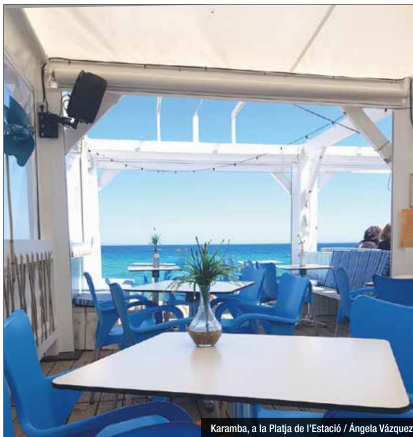
Karamba, a la Platja de l'Estació

Karamba , una guingueta situada a la Platja de l'Estació, també aposta pels concerts