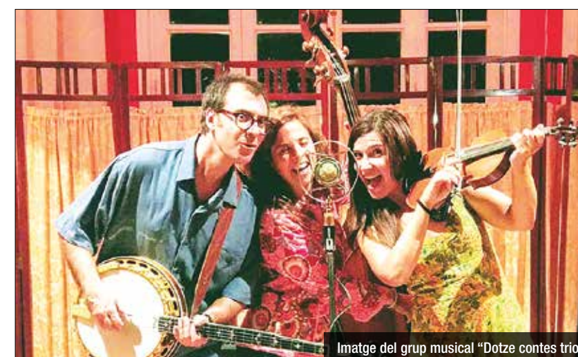
Imatge del grup musical "Dotze contes trio!"

vendres 5 de juliol actuaran els Magnolia, a les 21h, el dia 12 els Anthus, i el 19 de juliol els Dotze contes trio!. La venda d'entrades ja estan disponibles des d'aquest dimarts 18 de juny a la recepció del Museu. (horari: de dimarts a dissabte de 10 a 14 h i de 17 a 20 h. Diumenges de 10 a 14 h. No es fan reserves per telèfon. Aforament limitat. Màxim 4 entrades per persona. Preu: 15 euros (Amics del Museu: 12 euros).