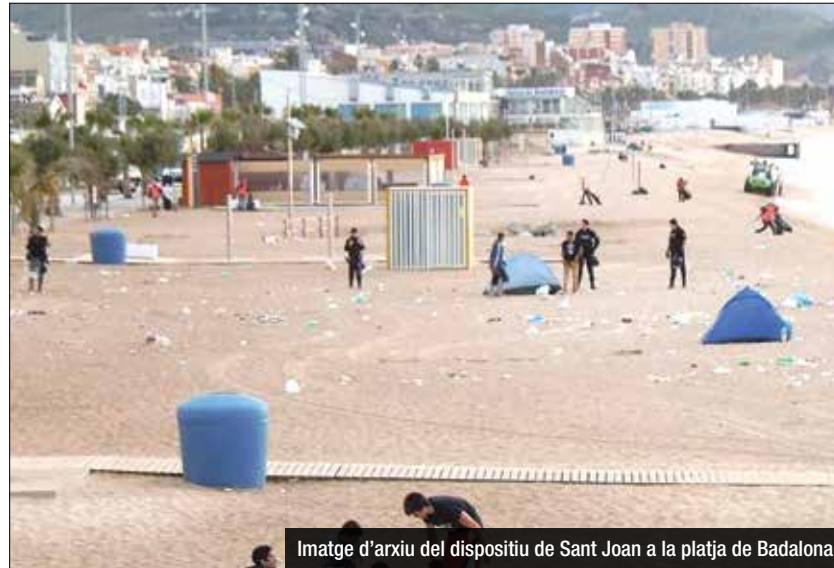
Imatge d'arxiu del dispositiu de Sant Joan a la platja de Badalona

Una Revetlla més, l'Ajuntament de Badalona ha previst un dispositiu especial per la nit d'aquest diumenge. Com cada any, la platja de la ciutat serà un dels punts més concorreguts de la nit i per aquest motiu l'Ajuntament vol assegurar el civisme i la convivència. Durant tota la nit hi haurà servei de salvament i socorrisme a les platges, de les 22h i fins a les 6h del matí del dia de Sant Joan. Les guinguetes de la platja hauran de tancar a les 4h de la matinada. A partir de les 5:45h de la matinada s'haurà de desallotjar les platges. Aquella hora, i acompanyats d'agents de la Guàrdia Urbana, començaran a treballar els serveis de neteja al litoral i també al passeig marítim. L'Ajuntament ha informat que els accessos en cotxe, pels passos subterranis, restaran restringits i que sancionarà als qui facin fogueres, ja que queda totalment prohibit. Recomanació d'anar a la platja a les 10h del dia de Sant Joan