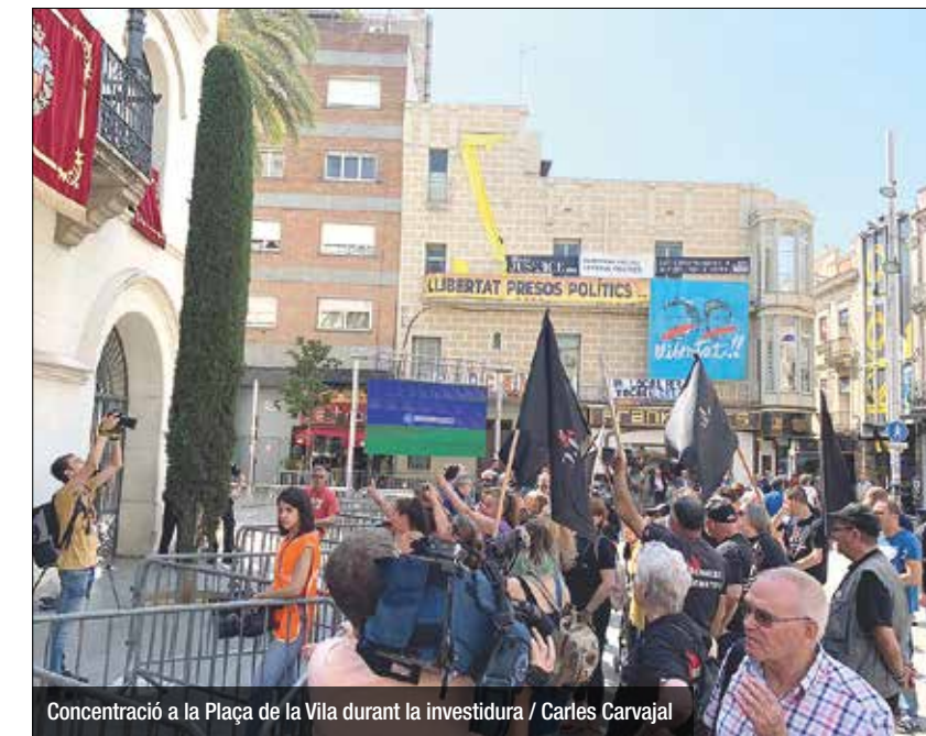
Concentració a la Plaça de la Vila durant la investidura / Carles Carvajal