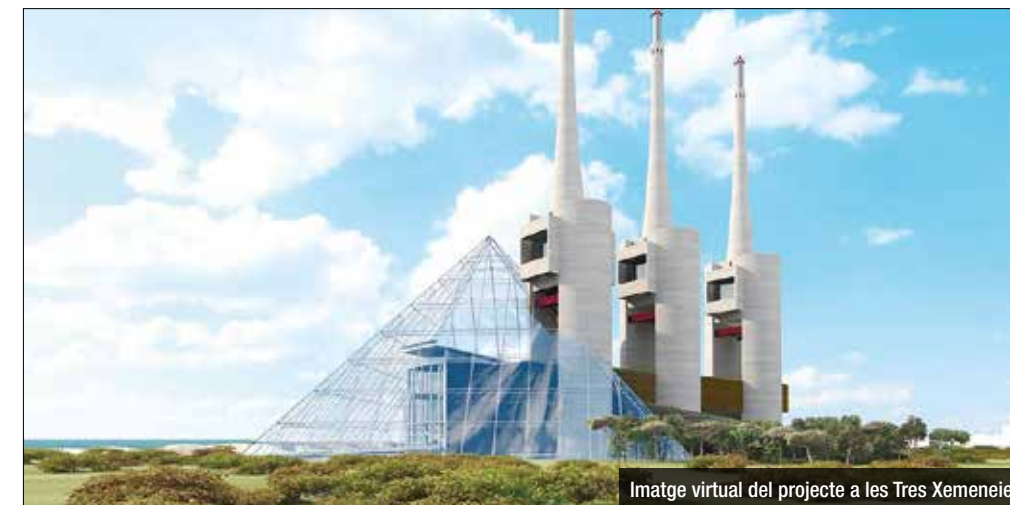
Imatge virtual del projecte a les Tres Xemeneies

El promotor egipci Mohamed Aly ha proposat convertir les Tres Xemeneies de Sant Adrià en un espai dedicat a la cultura de pau que inclouria una "gran universitat del Mediterrani" així com un museu mundial del personal de la pau de l'ONU, entre d'altres possibilitats. L'equip impulsor vol fer d'aquest espai un "pont entre Europa i Àfrica" i estaria ubicat a l'edifici de turbines i de les tres xemeneies. El projecte inclou la construcció d'una piràmide de vidre, similar a la del Museu del Louvre de París, al costat de les