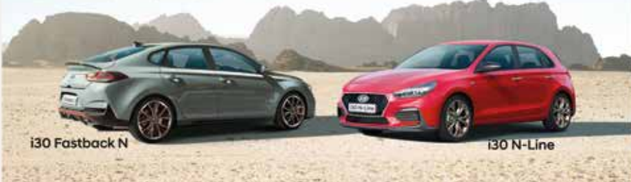
i30 Fastback N

Nova Gamma i30 N i N-Line Diversió elevada a N