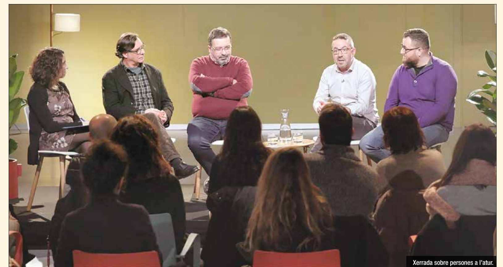
Xerrada sobre persones a l'atur.

i també com a punt de trobada perquè diversos actors socials puguin intercanviar punts de vista i sumar esforços. Els millors moments de les trobades es recullen en els diferents vídeos que formen la campanya, i que ja es poden veure a TV3 i a la pàgina web d'Aigües de Barcelona.