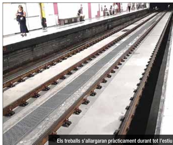
Els treballs s'allargaran pràcticament durant tot l'estiu

La L2 funcionarà de Pompeu a Sagrada Família