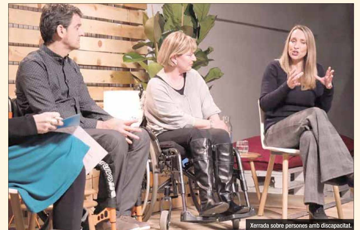
Xerrada sobre persones amb discapacitat.

integren la campanya està dirigida a un col·lectiu específic: famílies en risc d'exclusió; persones amb discapacitat; persones a l'atur i amb precarietat laboral; i gent gran en risc de vulnerabilitat. A més, cada xerrada compta amb la presència d'una moderadora, d'un personatge conegut relacionat amb el