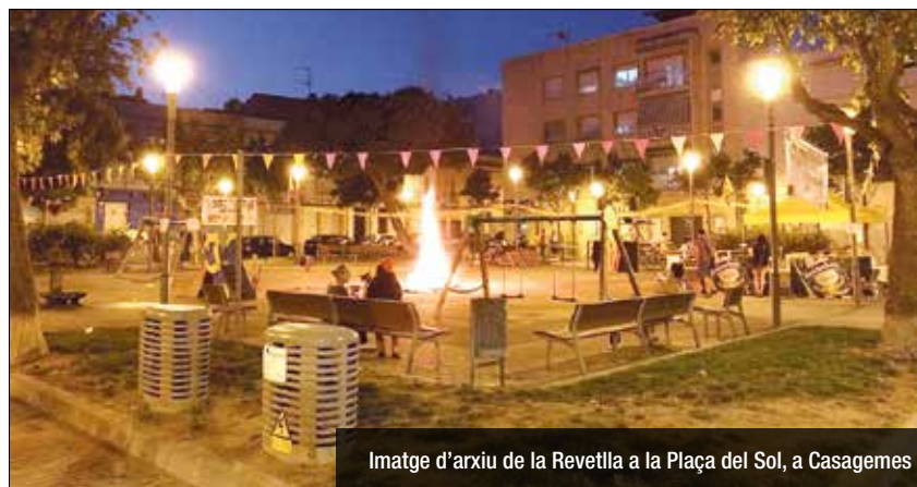
Imatge d'arxiu de la Revetlla a la Plaça del Sol, a Casagemes

temps de la mà de Cocodrilo Club. La festa a Llefià seguirà el dia de Sant Joan, amb una exhibició de cavalls, durant el matí a la plaça de la Pipa i el concerts de Flamenco Vivo, a les 20:30h i d'Ecós del Rocio, a les 21h, al parc del Gran Sol. Les festes de Sant Joan a Llefià incorporarà xocolatada, havaneres i sardinadam, festa de l'escuma o una xistorrada popular. Al barri de Casagemes, i per onzè any consecutiu, el Casal Antoni Sala i Pont organitza la Revetlla de Sant Joan. Enguany, cap a les 21h, arri-