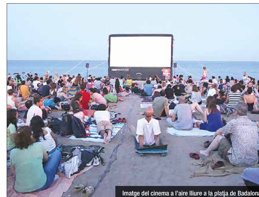
Imatge del cinema a l'aire lliure a la platja de Badalona

El 28-29 de juny i el 4-5-6 de juliol el Teatre del Círcol tornarà a acollir el Cryptshow, el Festival alternatiu de Terror i cinema fantàstic de caire internacional que ja s'ha consolidat com una de les grans propostes culturals a l'àrea metropolitana de Barcelona a principis d'estiu, més enllà del fet merament cinematogràfic, ja que també es proposa recitals de música, literatura i arts plàstiques. El Círcol acollirà tant la secció oficial com la de fora de competició del Festival de curts de Terror i cinema fantàstic, així com alguns llargmetratges.