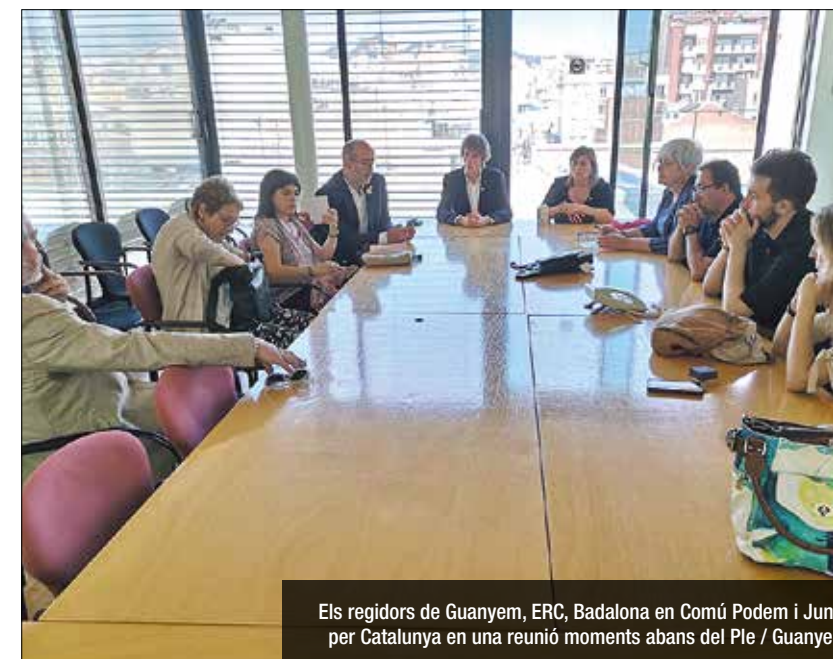
Els regidors de Guanyem, ERC, Badalona en Comú Podem i Junts per Catalunya en una reunió moments abans del Ple

incloure algunes clàusules que permetin ampliar el servei de recollida de mobles o instal·lar sensors als contenidors per avisar quan s'estan omplint. El manteniment dels equipaments esportius és una altra de les assignatures pendents i en el seu discurs va demanar "un pacte entre tots" perquè una empresa municipal se n'encarregui, el que agilitzaria molt més els processos. Pel que fa a la seguretat, l'Alcalde ha promès 200 noves places en 4 anys per compen-