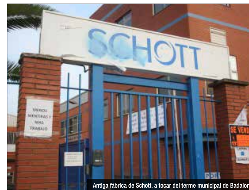
Antiga fàbrica de Schott, a tocar del terme municipal de Badalona

Schott Ibérica, dedicada a la fabricació de tubs de vidre, va tancar la planta de Sant Adrià el 2014 perquè no veia viable invertir-hi per modernitzar-la.