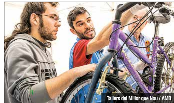
Tallers del Millor que Nou / AMB

Aquest dissabte 25 de novembre, al local del Millor que Nou a Barcelona (Sepúlveda 45-47) es duran a terme una sèrie d'activitats que contribuiran a donar noves vides a elements molt diversos. Al matí hi haurà assessorament de les especialitats habituals: tèxtil, bricolatge, electrònica i fusteria. A la tarda hi haurà cursos per aprendre a fer jardineres a partir de palets, cursos de reparació de joguines i sessions de construcció d'instruments per a infants. I per acabar un