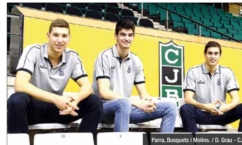
Parra, Busquets i Molins.

Les tres perles del planter renoven contracte