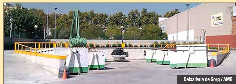
Deixalleria de Gorg / AMB

per superar l'estancament de la recollida de residus selectiva, que s'ha vist frenada els darrers anys. Per això s'estan oferint imports de fins a 3 milions d'euros a aquells Ajuntaments que volen incrementar la seva recollida.