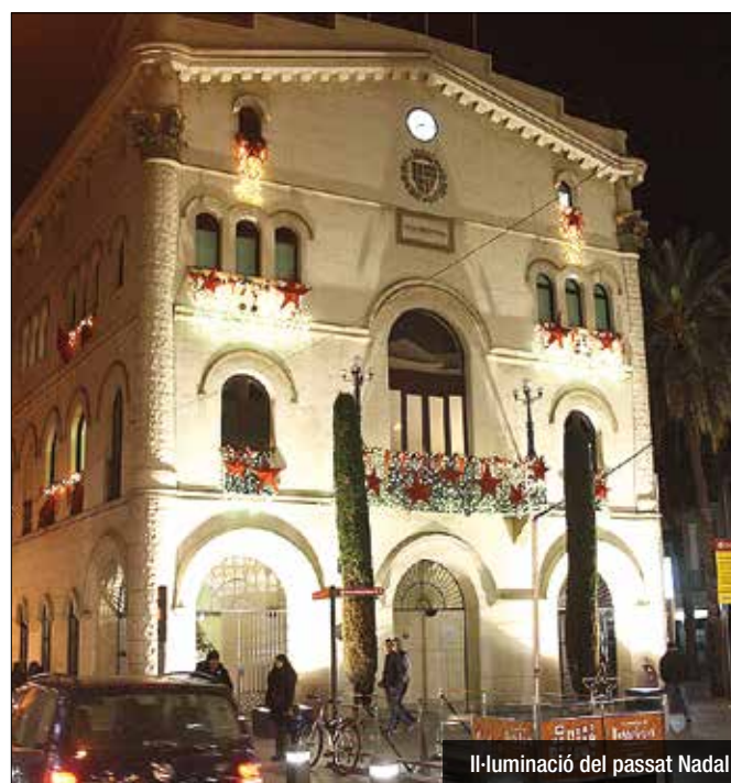
Il·luminació del passat Nadal

Alguns dels principals eixos comercials complementaran la decoració