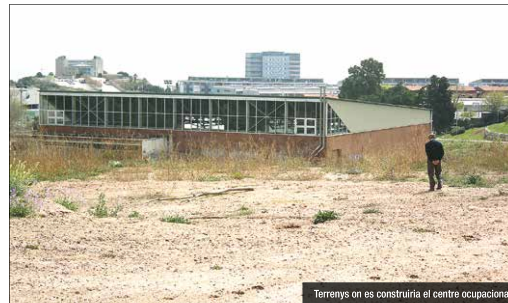
Terrenys on es construiria el centre ocupacional

Incasol i Fundació signarien una permuta de terrenys que desencallaria la polèmica