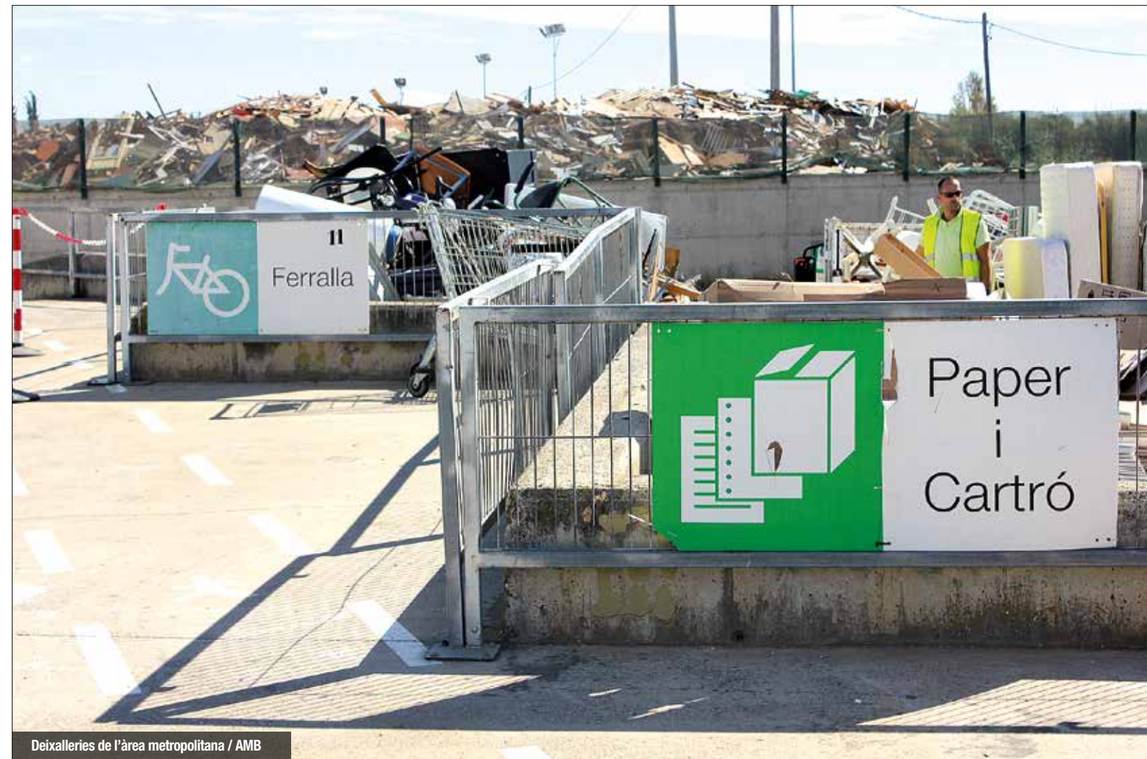
Deixalleries de l'àrea metropolitana / AMB

L'estratègia és visibilitzar que les deixalleries existeixen com punts on poder reaprofitar objectes, comprar-ne, intercanviar o fins i tot fer cursos on s'ensenya a reconvertir certs residus en material útil durant el dia a dia. "Tenim una xarxa de deixalleries prou potent que s'utilitza poc i volem apropar-les al ciutadà. Han de ser centres més actius i participatius", insisteix Eloi Badia.