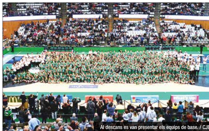
Al descans es van presentar els equips de base.

López-Arostegui (11 punts) i Vidal (17 de valoració), per desactivar tots els intents del GBC de capgirar el marcador. El matx va servir també per presentar tots els equips del planter verd-i-negre, en la millor entrada del curs (5.397 espectadors).