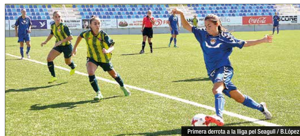
Primera derrota a la lliga pel Seagull

Superada la mitja hora de partit, l'Espanyol 'B' començaria a carburar. El filial fregaria l'empat en