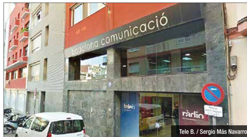
Tele B. / Sergio Más Navarro

de Ràdio Ciutat de Badalona a càrrec de Xavi Ballesteros. L'estrena, d'entrada, serà pel partit contra el Dinamo de Tbilisi del dijous que ve, però s'està treballant per poder oferir també el partit d'anada de dimarts, a partir de les cinc de la tarda. En aquest sentit, l'objectiu és arribar a acords amb les televisions dels diferents països que hagi de visitar el conjunt verd-i-negre per poder retransmetre també tots els partits que el conjunt de Diego Ocampo disputi fora de casa.