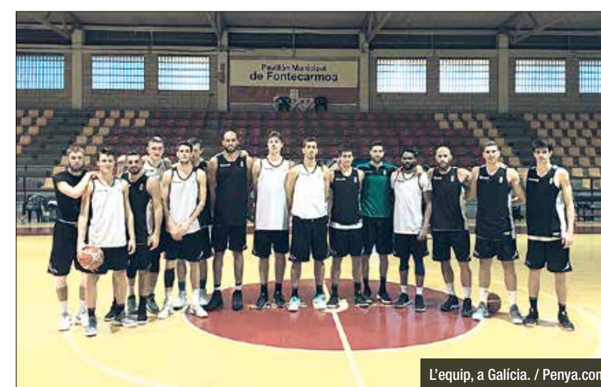
L'equip, a Galícia.

dos partits en la pretemporada. Va debutar perdent amb l'Estudiantes (89-83) i també va caure contra l'UCAM Múrcia (71-69). Els verd-i-negres, pel seu cantó, van caure contra el Morabanc Andorra a Sant Julià de Vilatorrada, en les semifinals de la Lliga Catalana (68-80), però posteriorment es van