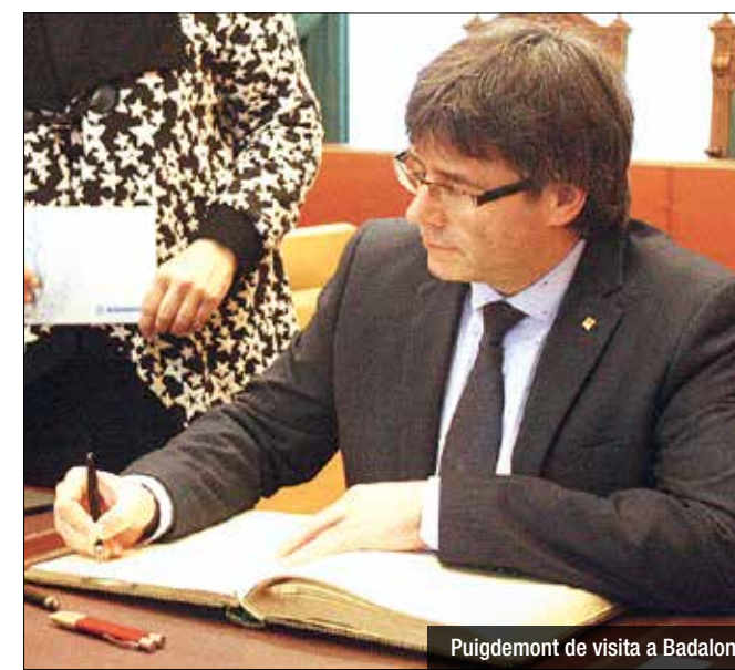
Puigdemont de visita a Badalona

Badalona serà un dels escenaris més moguts durant les properes setmanes abans de l'1 d'octubre. Si la CUP ja havia anunciat que la plaça de la Plana seria l'escenari del seu acte central de campanya pel 'Sí', el Partit Demòcrata s'ha avançat i ha escollit Badalona com a municipi per donar el tret de sortida al seu calendari d'actes, aquest divendres. Ho farà al Teatre Principal, ni més ni menys que amb el president de la Generalitat, Carles Puigdemont, al capdavant. L'acte donarà el tret de sortida a la campanya pel 'Sí' i començarà a les 19.30 hores. Puigdemont estarà