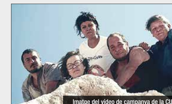
Imatge del vídeo de campanya de la CUP