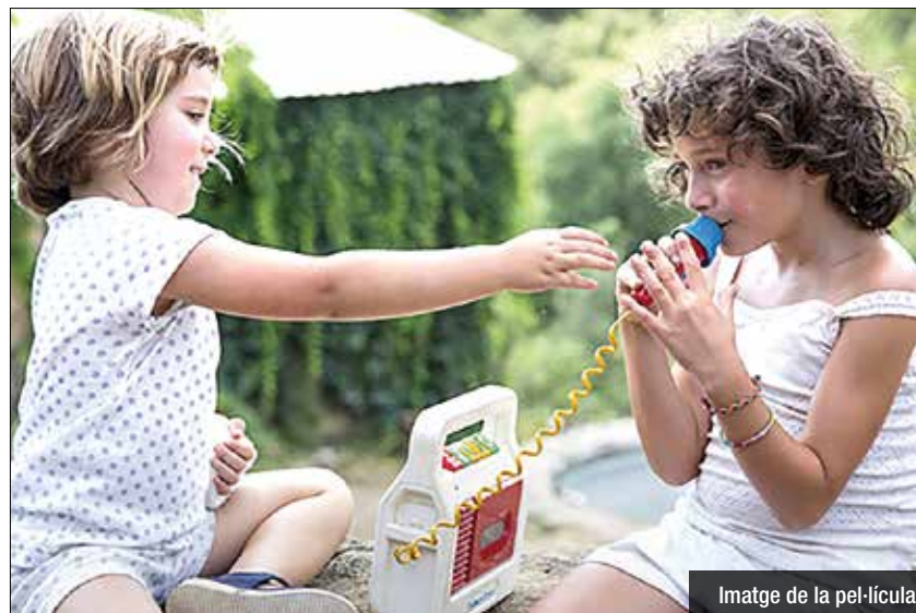
Imatge de la pel·lícula

el 30 de juny i des d'aleshores acumula un bon nombre de premis i reconeixements. Al Festival de Berlín es va emportar el Premi a Millor Òpera Prima, a més del Premi de la Generació KPlus. Al Festival de Màlaga va guanyar la Bisnaga d'Or i al Festival de Buenos Aires, el Premi a la Millor Direcció. 'Estiu 1993' segueix així el seu camí cap als Oscar, que celebrarà la seva 90a edició. En cas d'arribar a la selecció final, es convertiria en la primera pel·lícula rodada en català en optar a l'Oscar a la Millor Pel·lícula de Parla No Anglesa.