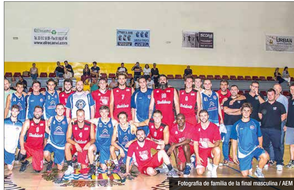
Fotografia de família de la final masculina