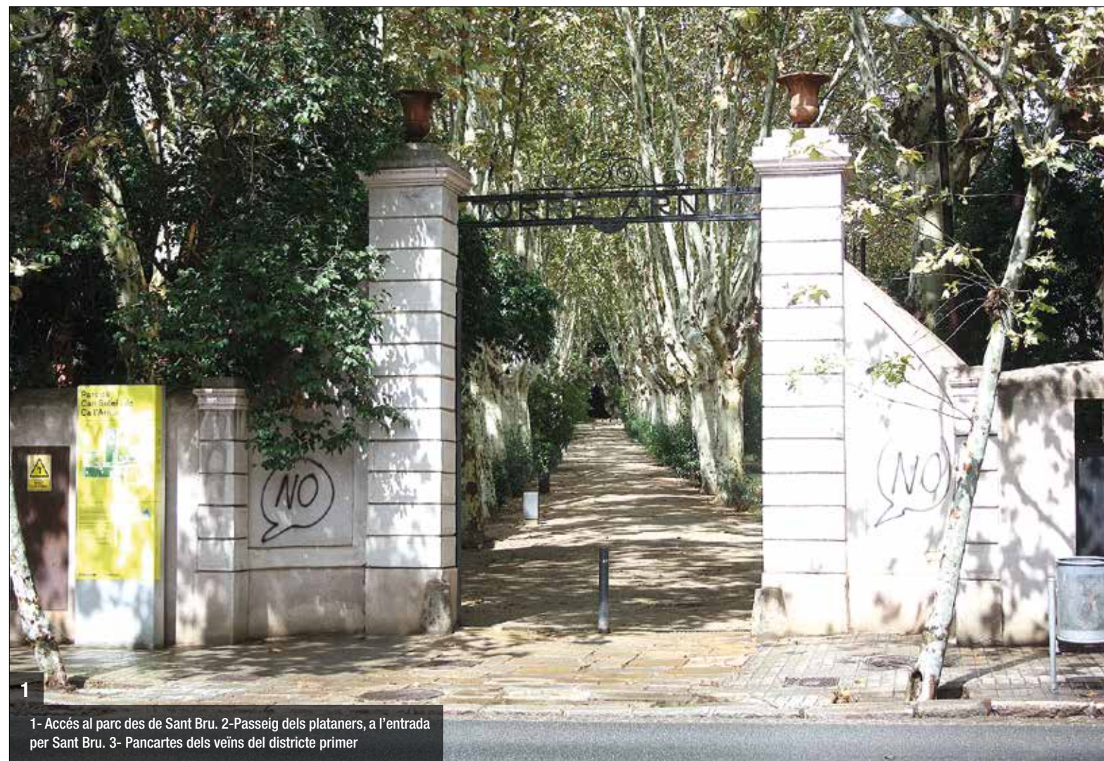
1- Accés al parc des de Sant Bru. 2-Passeig dels plataners, a l'entrada per Sant Bru. 3- Pancartes dels veïns del districte primer