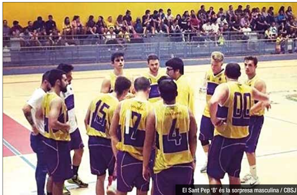
El Sant Pep 'B' és la sorpresa masculina / CBSJ

Com s'esperava, els principals favorits del quadre femení van fer