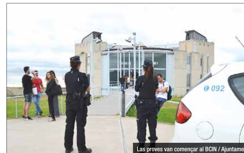
Las proves van començar al BCIN / Ajuntament

Les proves de selecció finalitzaran el 18 de setembre