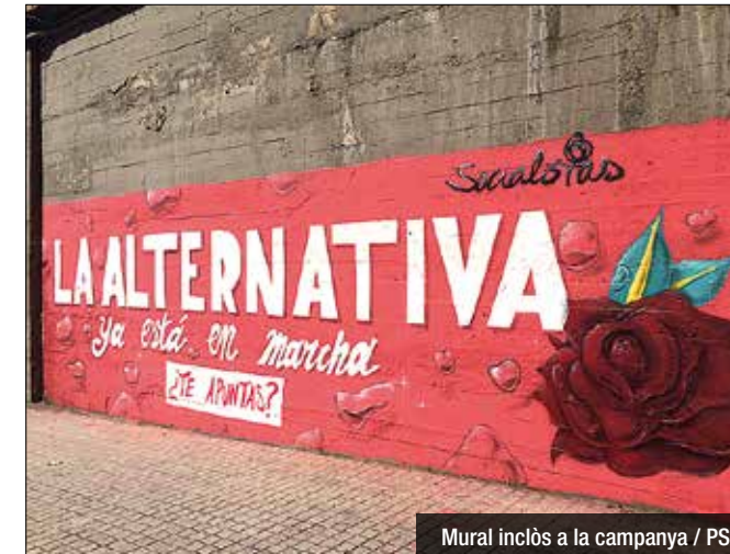
Mural inclòs a la campanya

Publiquen un vídeo amb Pedro Sánchez, Iceta i Parlon