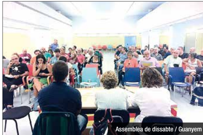
Assemblea de dissabte / Guanyem

La continuïtat dels càrrecs segueix enlaire