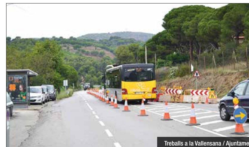
Treballs a la Vallensana

Durant les obres es regula el trànsit, quan sigui necessari, mitjançant el pas alternatiu ordenat per operaris i semàfor provisional d'obres.