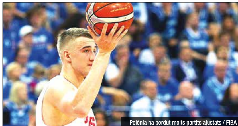
Polònia ha perdut molts partits ajustats

ys deixaven escapar duels igualats contra Finlàndia (90-87) i França (75-78), fet que els situava en un context de partit de vida o mort davant Grècia. En el matx decisiu per passar als vuitens de final de l'Eurobasket com a quart classificat del grup A, Polònia tornaria a fallar al final. L'inici seria esperançador (23-29) i, després de tenir dificultats durant el segon quart (49-43), els polonesos tornaven a activar-se (70-67) per arribar als últims minuts amb plenes opcions. La defensa, però, no va estar al nivell, encaixant un parcial de 25 a 10 que