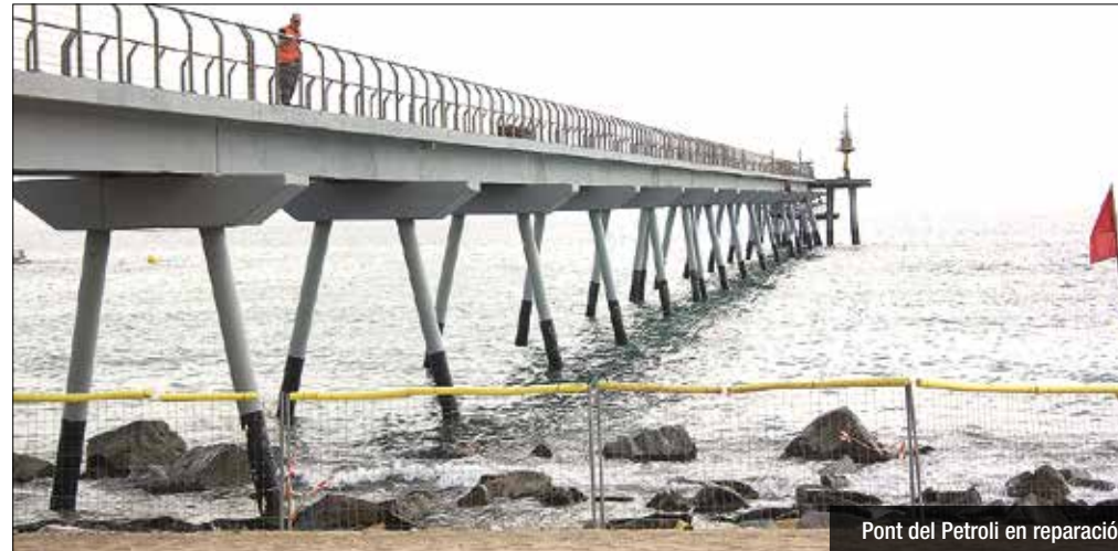
Pont del Petroli en reparació

Les obres avancen a bon ritme, tot i haver trobat danys addicionals