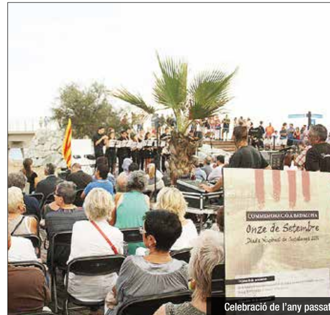
Celebració de l'any passat

Demòcrata organitzarà el seu sopar de la Diada a la plaça del Sol. Serà a partir de les 9 de la nit, i comptarà amb la diputada Míriam