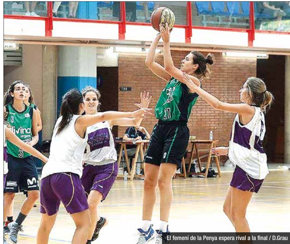
El femení de la Penya espera rival a la final

La 31ª edició de la Copa Badalona ja coneix qui seran els seus semifinalistes; i inclús ja hi ha un club classificat per optar al títol. Al llarg de la darrera setmana les pistes de la Plana i Casagemas han acollit els diferents compromisos de la fase de grups, duels que han dibuixat el següent calendari de rondes finals. En categoria masculina, el Círcol Cotonifici i l'AE Badalonès disputaran dissabte 9 de setembre (18:30h) una semifinal 'made in' Copa Catalunya a la Plana, mentre que la sorpresa del torneig, el Sant Josep 'B', i la Minguella es jugaran l'altra plaça per la final a les 20:30h i en el mateix escenari. Pel que fa a les noies, el Divina Seguros Joventut espera rival per la final, adversari que sortirà del duel previst per dissabte a les 16:30h a la Plana entre el Sant Andreu de Natzarret i l'AE Minguella. Un derbi de nivell.