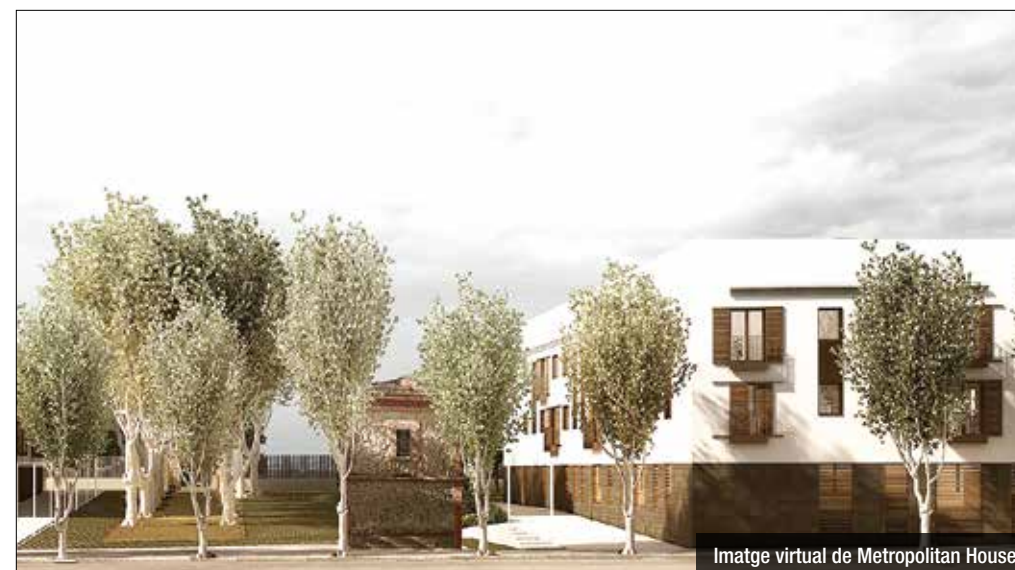
Imatge virtual de Metropolitan House

aquest dijous a la tarda a la Federació d'Associacions de Veïns, i de la qual podria sortir un posicionament clar. En qualsevol cas, la notícia no es veu amb bons ulls des de les entitats.