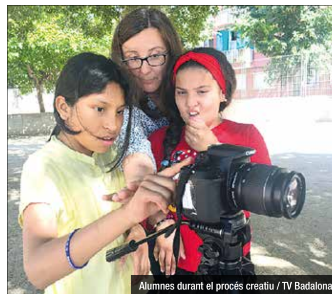
Alumnes durant el procés creatiu