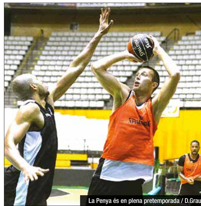
La Penya és en plena pretemporada

trenar amb intensitat cada dia per influir positivament en els meus companys", adverteix l'exterior verd-i-negre. El combo-guard del Divina es considera "un jugador amb capacitat per fer una mica de tot". "Puc llançar bé a cistella, aportar dribbling, dirigir els meus companys a pista i també m'agrada defensar", assegura. Per en Patrick, afrontar al costat de la seva família una nova aventura a Badalona suposa un repte apassionant. "Fa sis anys que vaig acabar la universitat, però a nivell professional les coses no van començar bé a causa d'una lesió. Vaig haver de començar de zero a Austràlia. Des d'allà em vaig guanyar fer el salt", recorda l'exterior del Divina.