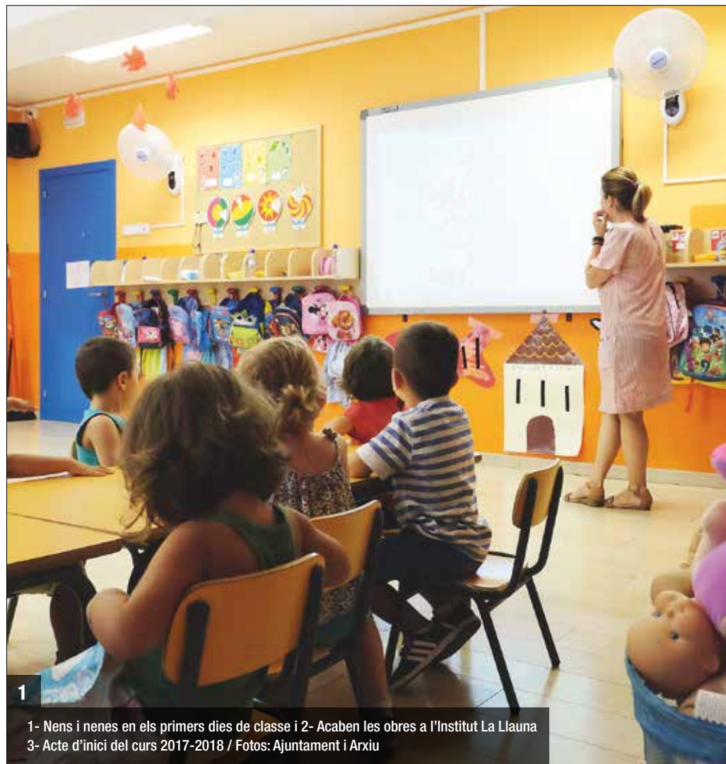
1- Nens i nenes en els primers dies de classe i 2- Acaben les obres a l'Institut La Llauna 3- Acte d'inici del curs 2017-2018

Pel que fa a les escoles bressols municipals i les dues de la Generalitat de Catalunya, que ja han començat aquesta setmana el curs, tenen totes les places ocupades i, fins i tot, tenen llista d'espera, amb una oferta superior a les 600 places. En aquest curs escolar continua vigent el sistema de tarificació social iniciat en l'anterior, tot mantenint la mateixa escala de preus i bonificacions per al servei d'escolarització. El total de les aportacions familiars apunta una reducció mitjana del 10% respecte al curs passat. Enguany el preu del menjador escolar s'integra