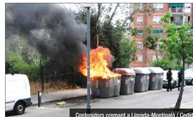
Contenidors cremant a Lloreda-Montigalà

Aquest dimecres va ser detingut un noi a la zona de Montigalà mentre intentava cremar contenidors públics. Es tracta d'un menor, veí de la ciutat, al qual se li vincula, presumptament, amb el grup de persones que darrerament ha provocat un augment molt assenyalat dels incendis de contenidors no només a Lloreda, sinó a diferents punts de la ciutat. Des de fa setmanes la Guàrdia Urbana, a través d'un dispositiu especial de la Divisió de Proximitat, ha estat investigant els incendis de contenidors que de forma reiterada s'han anat produint principalment als barris de Lloreda, Nova Lloreda i Sant Crist. Aquest treball de seguiment preventiu ha estat cabdal i ha fet possible la detenció d'aquest presumpte piròman. Els agents van poder localitzar aquest jove després que comencés a cremar un contenidor al carrer Sant Fermí del barri de