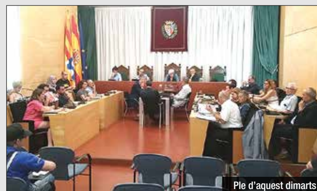
Ple d'aquest dimarts

propietàries que cedeixin pisos a l'Oficina Local d'Habitatge de Badalona.