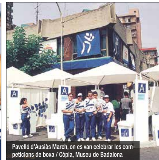
Pavelló d'Ausiàs March, on es van celebrar les competicions de boxa