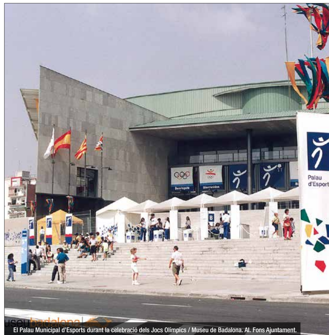
El Palau Municipal d'Esports durant la celebració dels Jocs Olímpics

i la pota nord d'entrada a Barcelona des del Maresme, com a actuacions més destacades. A nivell social, els Jocs van deixar un imaginari col·lectiu com a ciutat que va viure molt intensament aquell gran esdeveniment. I que, de fet, va evolucionar en la creació d'una entitat essencial que encara perdura: Voluntaris Badalona. Aquests dies, una exposició a la planta baixa de la Casa de la Vila recorda l'efemèride, amb fotografies, objectes, roba i documents que fan referència als Jocs. Aquest divendres és el darrer dia per poder-la gaudir. El Museu de Badalona, per la seva part, ha afegit al seu àlbum digital, a la plataforma Flickr, nombroses fotos sobre la celebració i preparació dels JJOO.