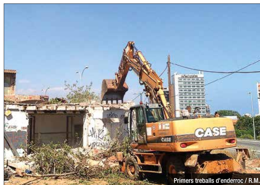
Primers treballs d'enderroc / R.M.

Finalment ja han començat els enderrocaments imprescindibles per a construir el lateral de la C-31 entre President Companys i Coll i Pujol. Tot i que estava inicialment previst que s'encetessin a finals de maig o principis de juny, s'ha hagut d'esperar fins a finals de juliol per veure els primers moviments.