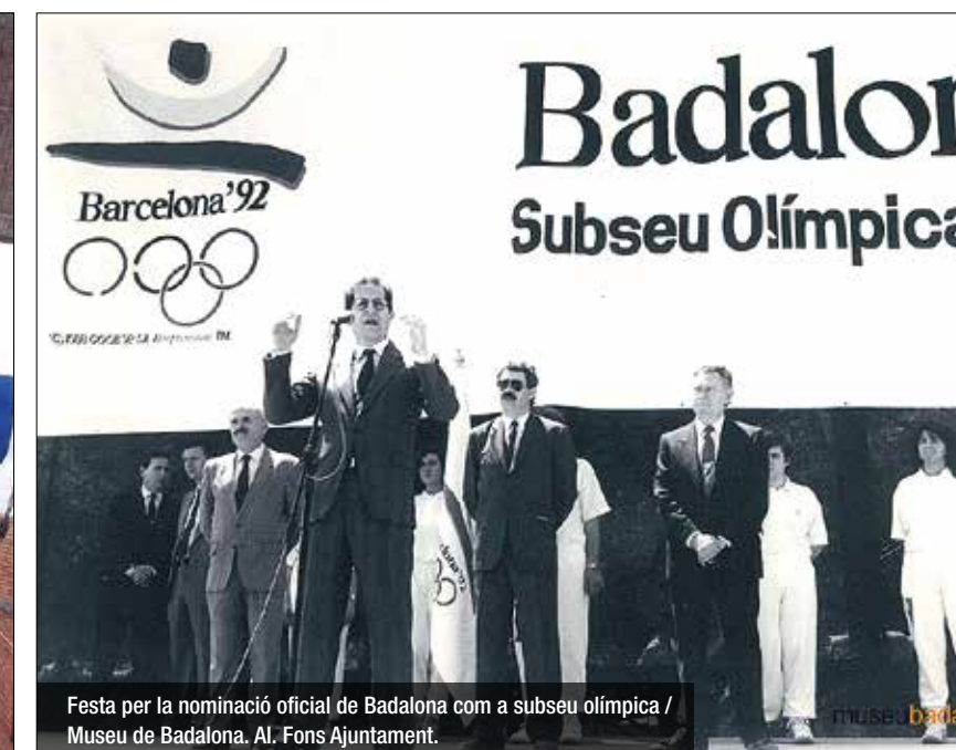
Festa per la nominació oficial de Badalona com a subseu olímpica / Museu de Badalona. Al. Fons Ajuntament.