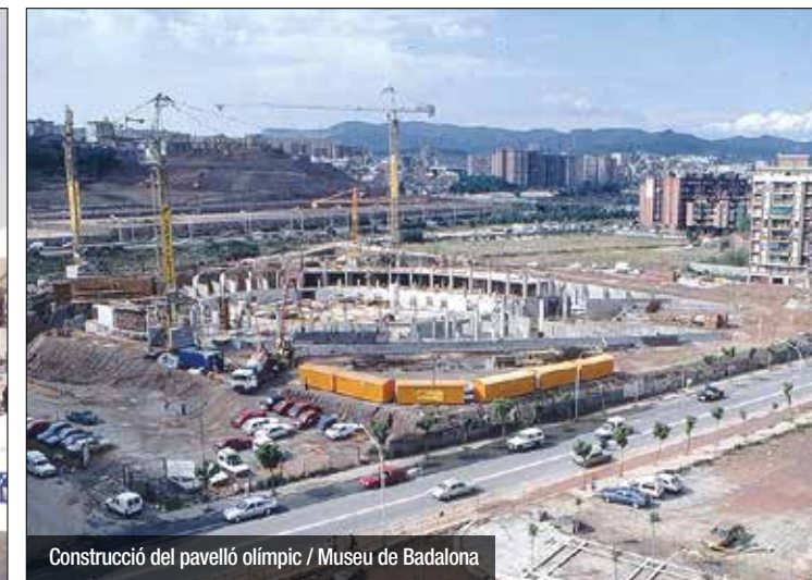
Construcció del pavelló olímpic