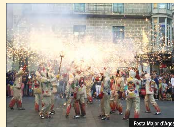
Festa Major d'Agost

TANDA DE LLUÏMENT a càrrec de Badalona Bèsties de Foc, Diables de Badalona, Bufons del Foc, Miquelets de Badalona,