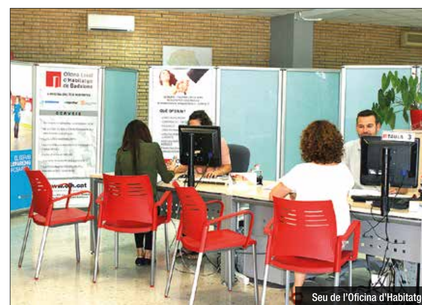
Seu de l'Oficina d'Habitatge

Un total de 800.000 euros provinents de la Diputació