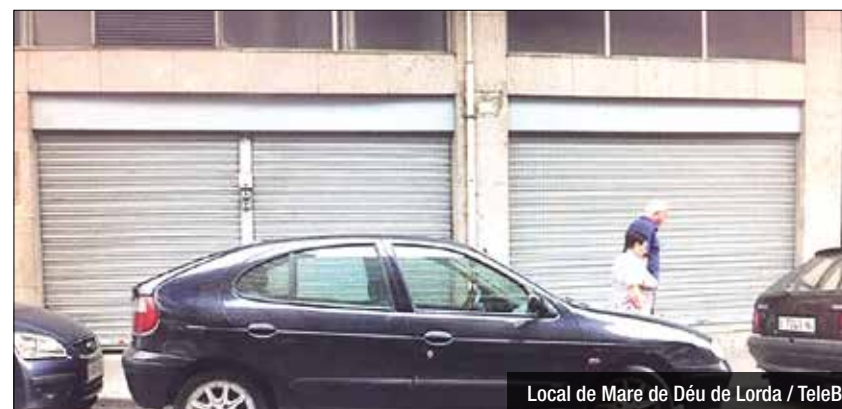
Local de Mare de Déu de Lorda / TeleB

L'Ajuntament invertirà 300.000 euros en rehabilitar un local públic