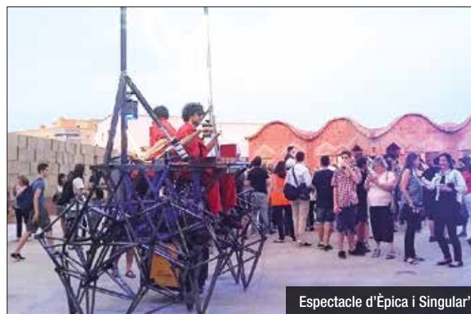
Espectacle d'Èpica i Singular