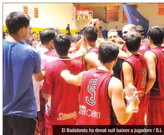
El Badalonès ha donat vuit baixes a jugadors / B.L.

"Hem fet incorporacions que ens donaran més bàsquet. Venen jugadors amb un perfil de més coneixement del joc. Això ens ajudarà a polir mancances que teníem la temporada passada", assegura