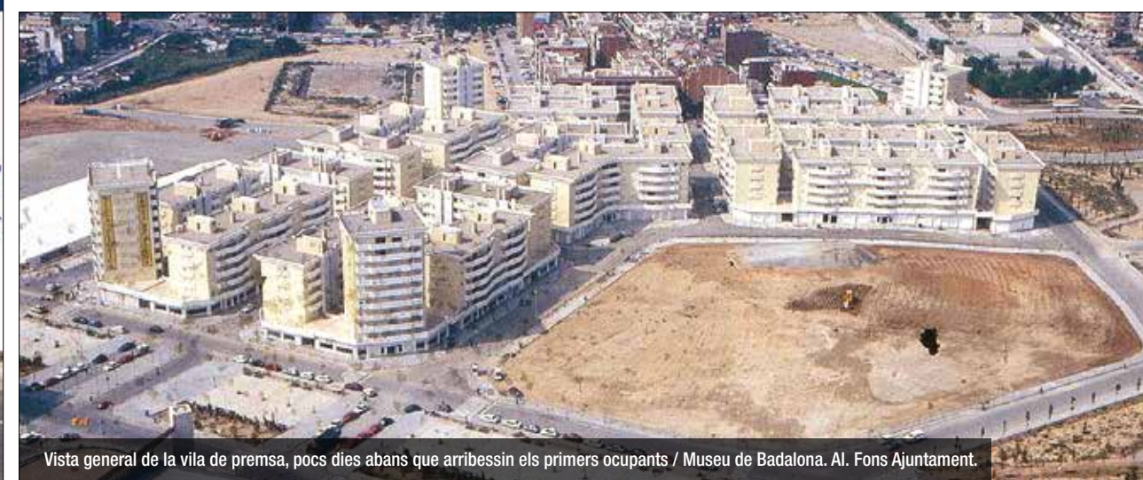
Vista general de la vila de premsa, pocs dies abans que arribessin els primers ocupants