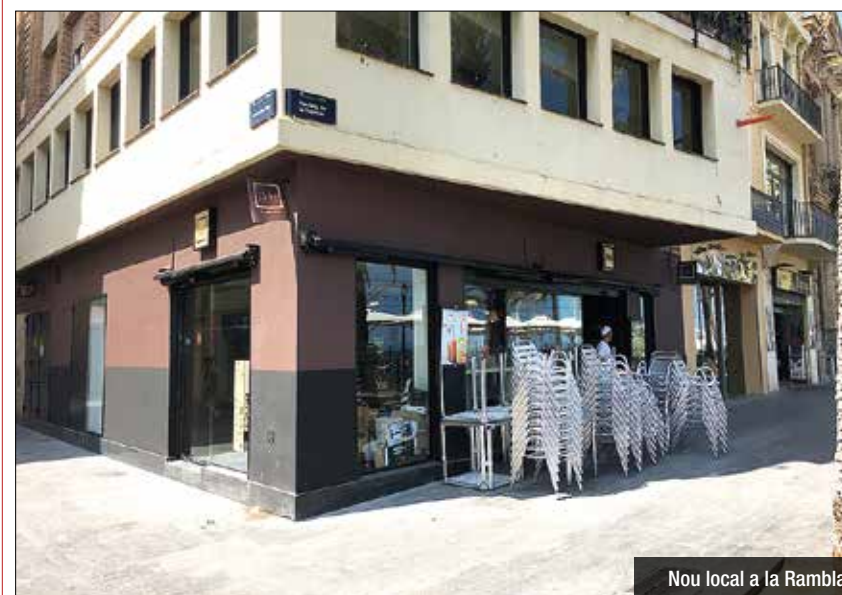
Nou local a la Rambla

Tancada l'etapa de la cadena de 'fastfood' Burger King, la cantonada de carrer de Mar amb Rambla iniciarà properament una nova època en la qual tornarà a ser cafeteria. La franquícia 365, fleca i degustació que s'ha expandit a Barcelona aquests darrers anys, prendrà el relleu. El local continuarà dividit en dues plantes i comptarà amb un element d'allò més original: un espai de 'show cooking'. A la primera planta hi haurà un obrador de pa visible per a tots els clients i