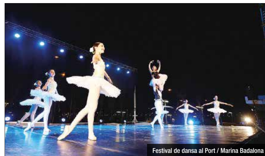
Festival de dansa al Port / Marina Badalona

Divendres comptarà amb ballarins badalonins que triomfen arreu