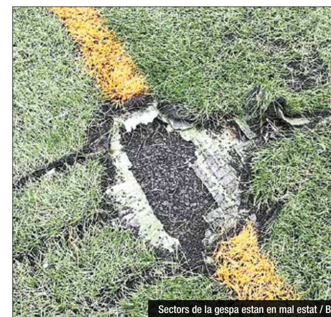
Sectors de la gespa estan en mal estat / B.L.

principals motius de preocupació del CF Bufalà és el risc de lesió que tenen els jugadors del club. La gespa s'està separant i, segons l'entitat, "cal afegir-hi cautxú, respallar-la i corregir les irregularitats en forma de bombolla que hi ha". En relació a la caldera, aquesta tampoc funciona amb normalitat i els futbolistes de l'entitat s'han de dutxar amb aigua freda. La llarga llista de desperfectes del Municipal no finalitza aquí. Com a defecte estructural principal s'ha de destacar l'entrada constant d'aigua i d'humitats a les instal·lacions interiors del camp (passadissos i vestidors). Quan plou amb força, sota les grades entra aigua per tot arreu, amb la perillositat que això comporta, sobretot a la zona d'oficines (sempre hi ha aparells endollats). Segons l'informe emès pel club i complementat amb imatges, "una de les bombes de rec no funciona i el reg automàtic tampoc". A més,