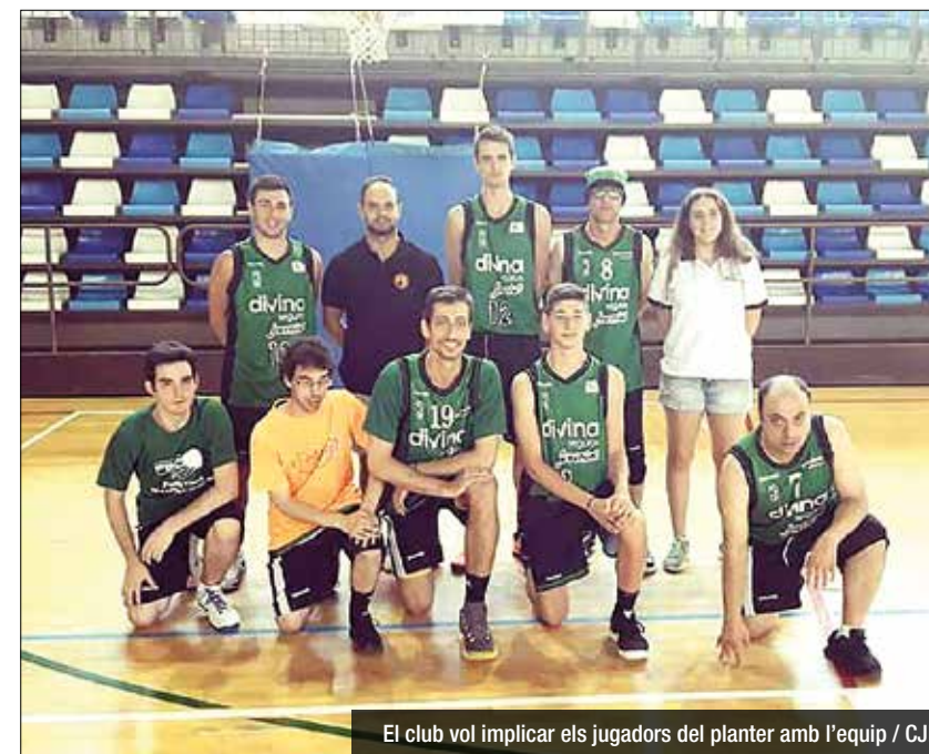
El club vol implicar els jugadors del planter amb l'equip / CJB

Després d'una temporada caminant junts, el Divina Seguros Joventut i la Fundació Fedamar fan un bon balanç del seu projecte d'equip per a persones amb discapacitat intel·lectual. El Joventut Fedamar ha competit aquest any en la màxima categoria catalana, la Lliga Preferent, donant l'oportunitat a molts joves de practicar l'esport de la cistella en un entorn immillorable. Badalona és una ciutat de bàsquet per excel·lència i és per això que des del club i la Fundació es vol reforçar encara més el projecte incluint el curs passat. De cara a la pròxima temporada, la idea és ampliar l'oferta de places. Les dues entitats ja treballen per configurar un nou equip d'iniciació i així dotar la iniciativa de dos nivells; dues opcions perquè tothom que s'hi vulgui apuntar realment pugui jugar sense tenir en compte el nivell de joc que pot oferir. Des d'aquest moment, tant la Peña com la Fundació Fedamar busquen jugadors amb discapacitat intel·lectual que es vulguin sumar als seus equips. Després de les vacances d'estiu, les