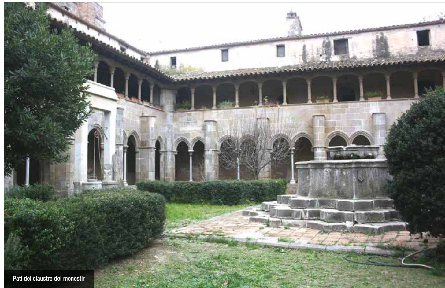
Pati del claustre del monestir

En qualsevol cas, la primera jugada ha d'arribar del costat dels propietaris, que tenen repartides les múltiples i diferents parts del monestir. Els descendents de la família Güell, una vintena de persones, en controlen