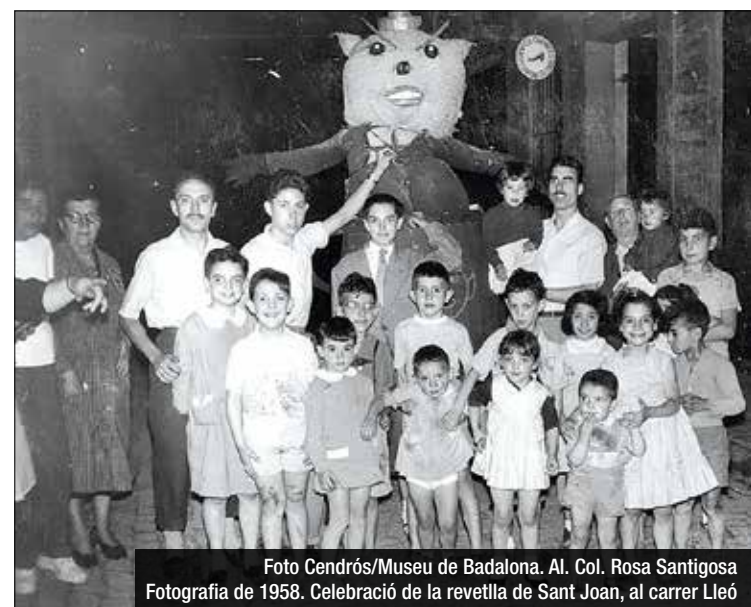
Fotografia de 1958. Celebració de la revetlla de Sant Joan, al carrer Lleó