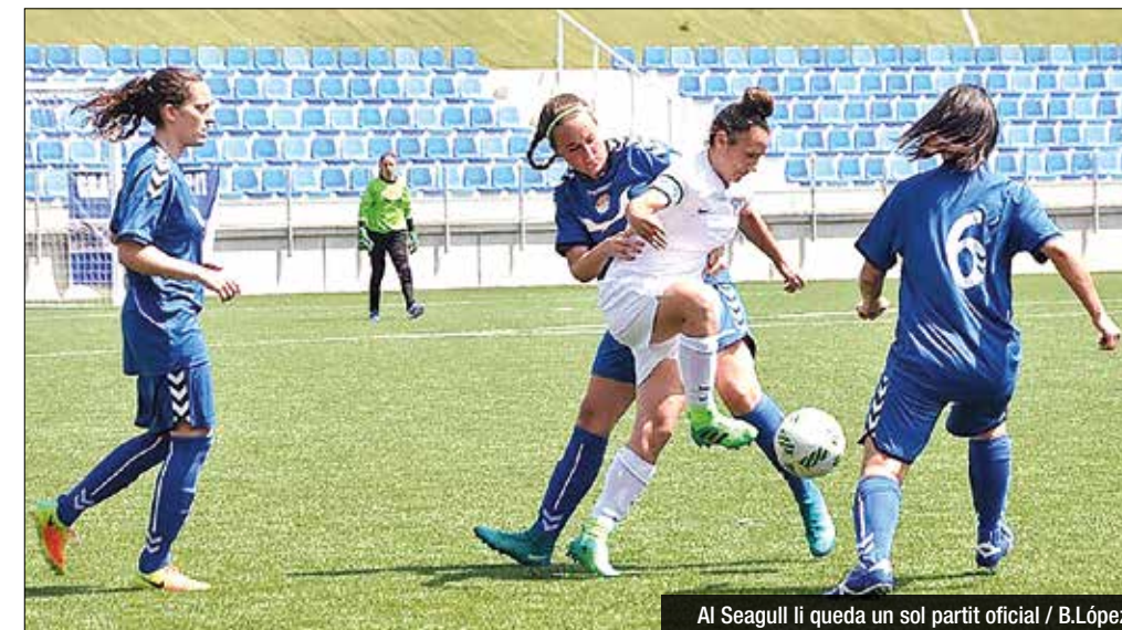
Al Seagull li queda un sol partit oficial / B.López

L'extrem del Pallejà és el primer fitxatge pel projecte 2017-2018 que dirigirà Ferrón