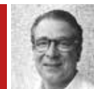
President de l'associació de comerciants i veïns del Turó d'en Caritg