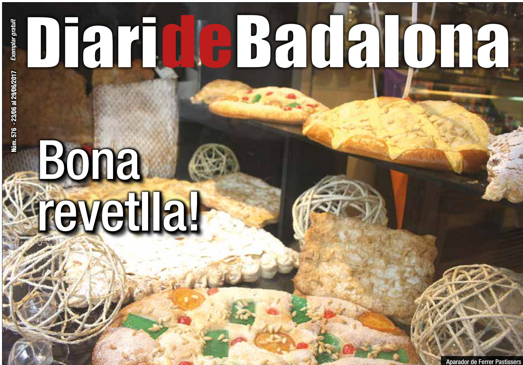
Aparador de Ferrer Pastissers