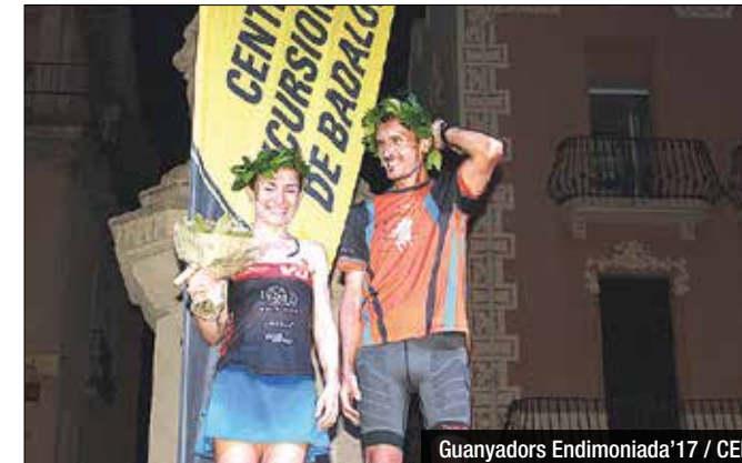
Guanyadors Endimoniada'17 / CEB

D'altra banda, els guanyadors del Premi Especial La Sargantana,