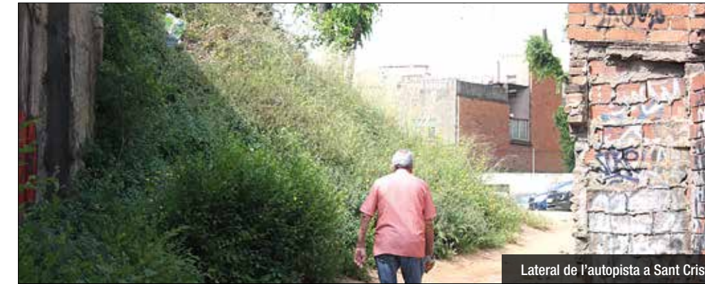
Lateral de l'autopista a Sant Crist

L'Ajuntament comença a licitar diferents reurbanitzacions i reformes del Pla Recupera