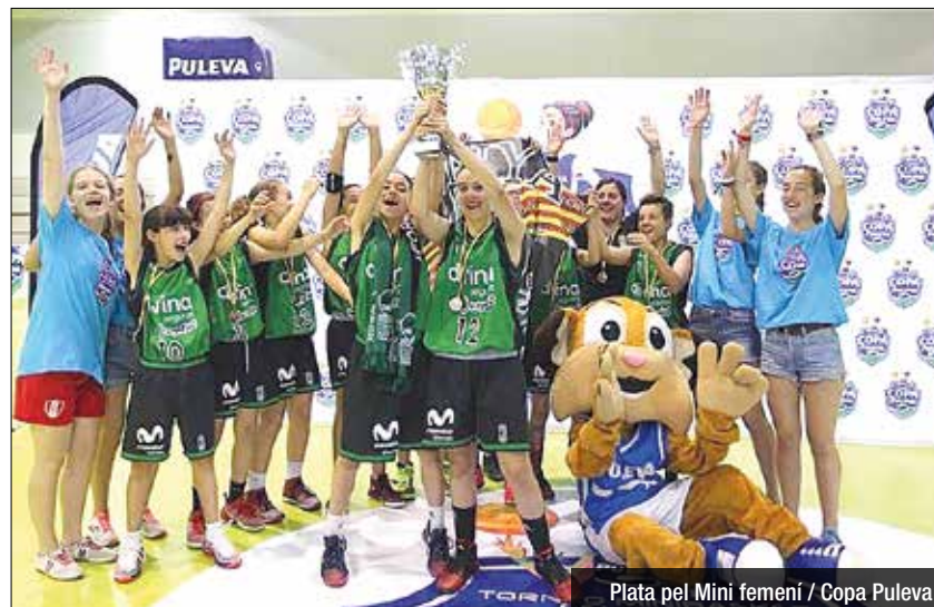
Plata pel Mini femení / Copa Puleva

El València i el Madrid eviten que la Peña es proclamï campiona de dues competicions on hi eren els equips més destacats d'Espanya