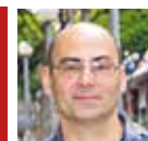
President de la Federació de Comerciants de Badalona