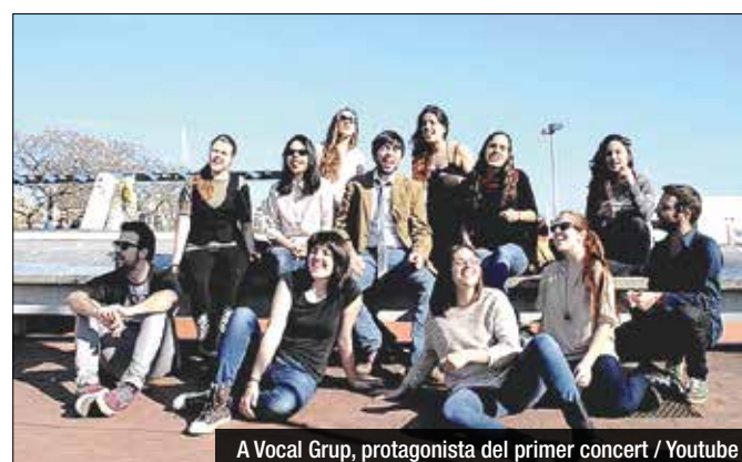
A Vocal Grup, protagonista del primer concert

Aquesta és una nova iniciativa de l'Orfeó que pretén apropar la música i la dansa a tot el públic badaloní i donar a conèixer el nou espai de la Casa Tolrà, una construcció d'estil modernista i protegida com a Patrimoni Cultural d'Interès Local que data del 1909. El cicle Tardes en Viu al Badiu Tolrà, que s'allargarà fins al 15 de juliol, inclou espectacles de música i dansa d'estils diversos a càrrec de diferents grups