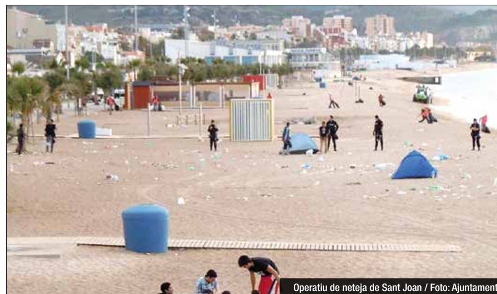
Operatiu de neteja de Sant Joan

En aquest operatiu hi participen els serveis municipals de Medi Ambient, d'Espais Públics i de Guàrdia Urbana, Mossos d'Esquadra i personal de l'Àrea Metropolitana de Barcelona.