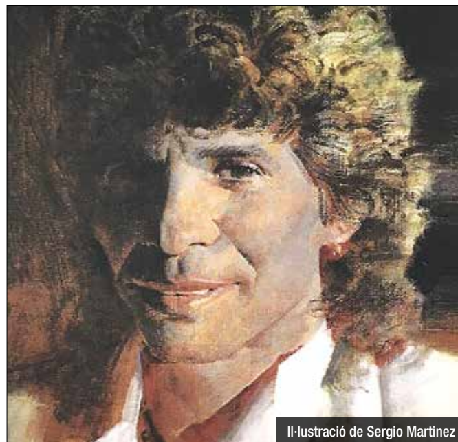
Il·lustració de Sergio Martínez

Amb motiu del 25è aniversari de la seva mort