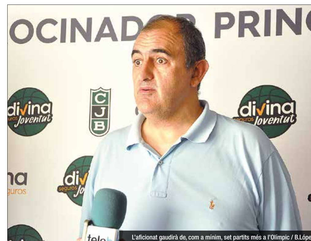
L'aficionat gaudirà de, com a mínim, set partits més a l'Olimpic

Els aficionats de la Penya que assisteixen a l'Olimpic en els duels de BCL podran presenciar molt protagonisme dels jugadors joves. La idea, tot i que encara s'ha de definir, és que la Champions sigui un escenari de pur ADN Penya. "Només en la fase regular ja disputarem 14 partits de bon nivell. Penso que a l'equip li anirà