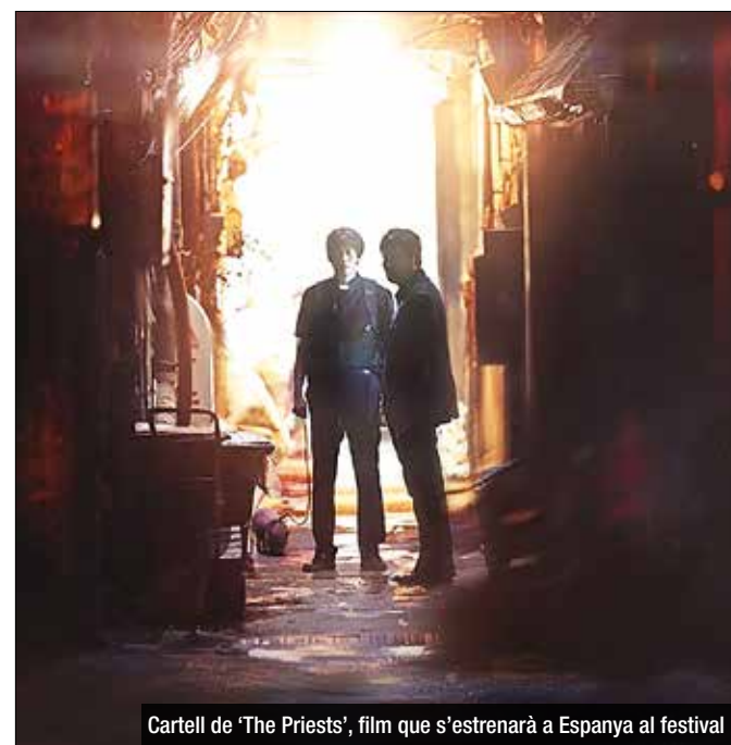
Cartell de 'The Priests', film que s'estrenarà a Espanya al festival

El certamen de terror i fantasia arriba a la seva 11a edició