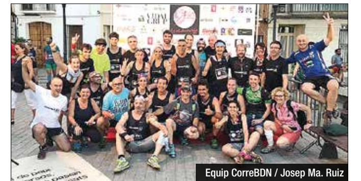
Equip CorreBDN / Josep Ma. Ruiz