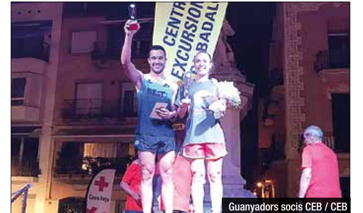
Guanyadors socis CEB / CEB

L'equip CorreBDN va tornar a ser l'equip que va aportar més participants a la cursa