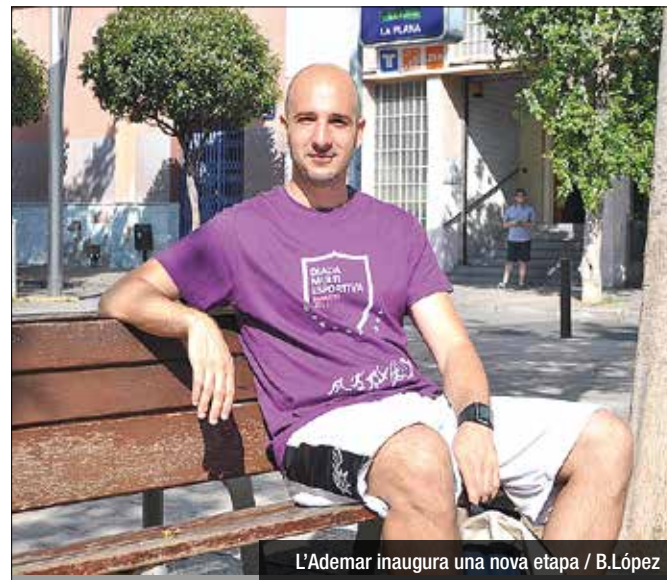
L'Ademar inaugura una nova etapa / B.López

La filosofia de treball que Joan Sánchez vol implantar és molt