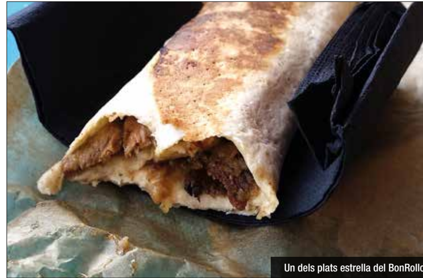
Un dels plats estrella del BonRollo

El primer dia van començar amb dues persones i una bicicleta per repartir, poc