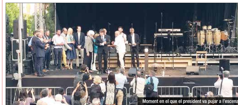
Moment en el que el president va pujar a l'escenari

Principal reclamació de l'AV de Sant Joan durant l'inici de les festes