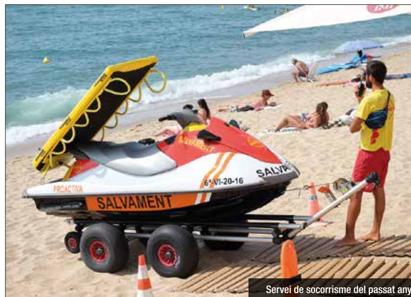
Servei de socorrisme del passat any

Serà el grup encarregat de la vigilància de platges aquest estiu