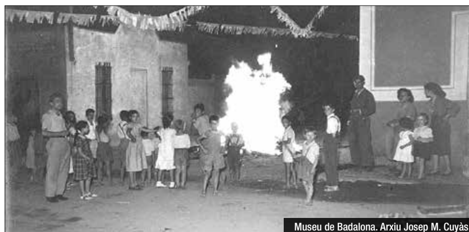
Museu de Badalona. Arxiu Josep M. Cuyàs