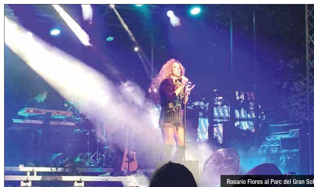
Rosario Flores al Parc del Gran Sol