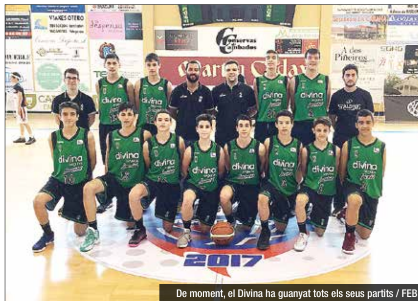
De moment, el Divina ha guanyat tots els seus partits