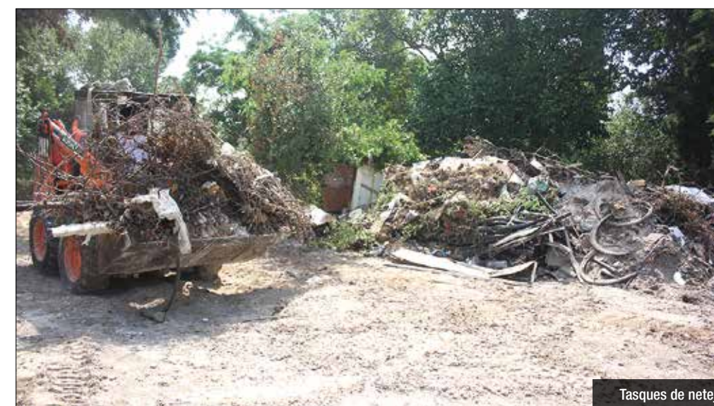
Tasques de neteja

Es prendran mesures per evitar que torni a omplir-se de residus