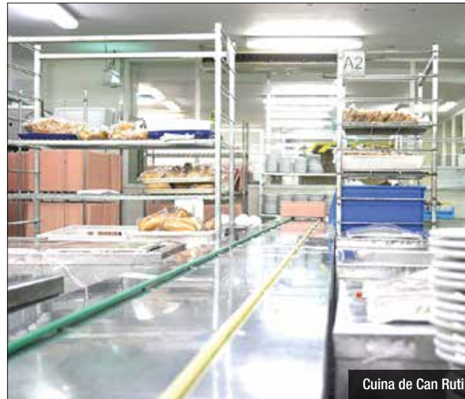
Cuina de Can Ruti

És la primera iniciativa d'aquests tipus a un gran hospital català