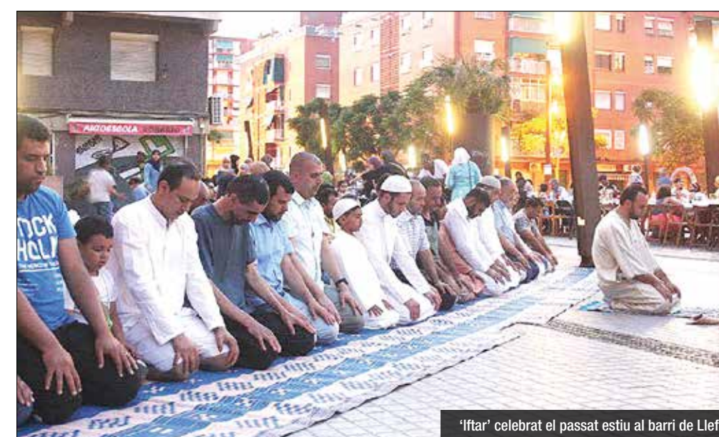
'Iftar' celebrat el passat estiu al barri de Llefia

Ajuntament i comunitat musulmana organitzen 'iftars' a diferents punts de la ciutat