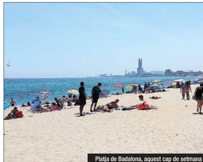
Platja de Badalona, aquest cap de setmana

Gris inici de temporada de platges, el passat cap de setmana,