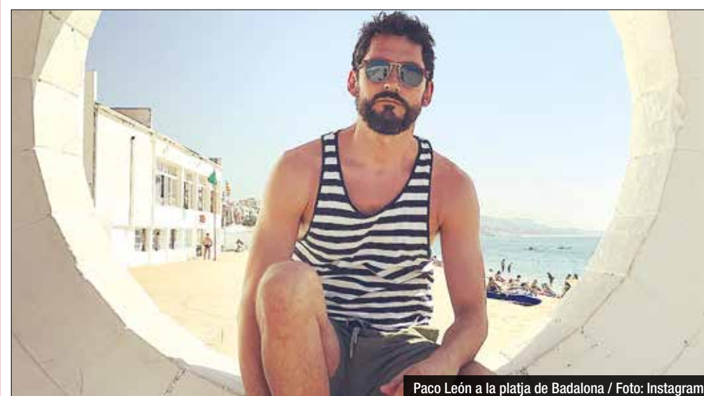
Paco León a la platja de Badalona

La ciutat és una de les localitzacions del film