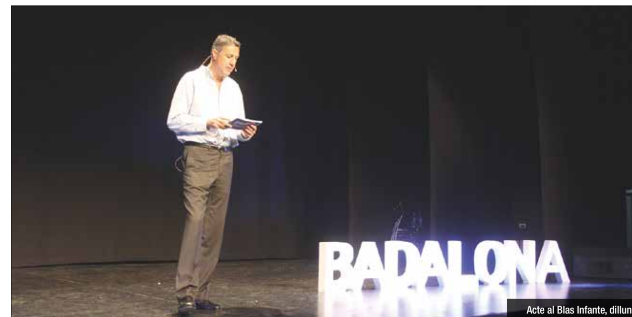
Acte al Blas Infante, dilluns

Tornarà a ser l'alcalde 'popular' tot i continuar com a cap visible al Parlament