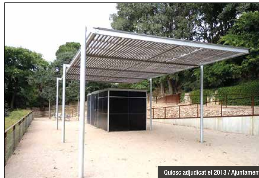
Quiosc adjudicat el 2013

L'Ajuntament treu a concurs la concessió de servei de bar