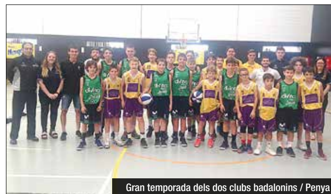
Gran temporada dels dos clubs badalonins / Penya

partits previs, el duel decisiu per definir el campió de Catalunya enfrontaria als dos conjunts que més bon bàsquet han practicat durant l'any. La final seria clarament verd-i-negra, ja que el Divina exhibiria un nivell d'encert impossible de compensar per un Sant Josep lluitador. Els 63 punts convertits pels verd-i-negres a la mitja part (63-40) deixarien el títol lligat a favor de la Penya (120-83).