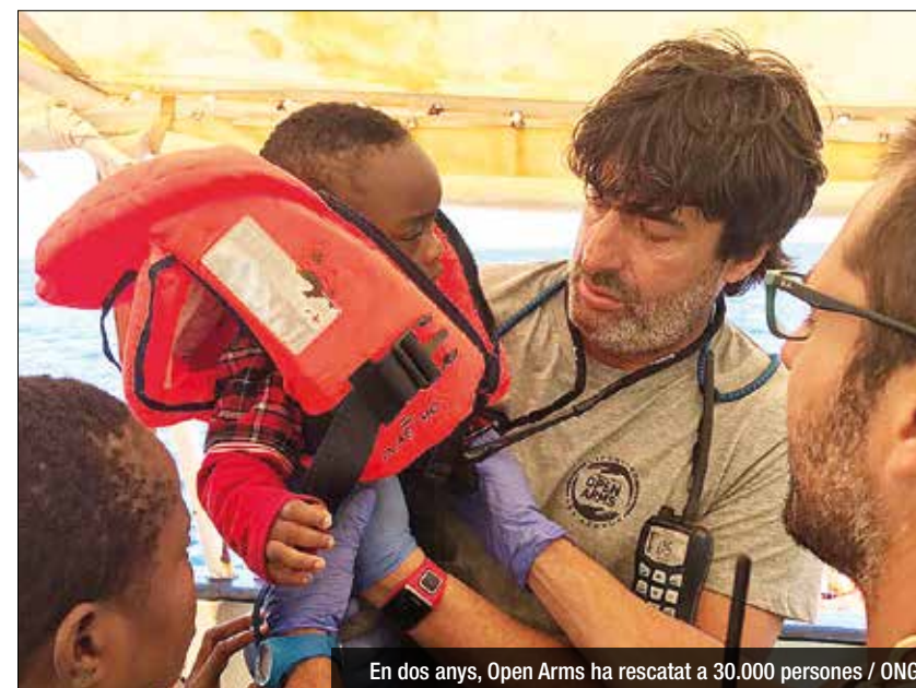
En dos anys, Open Arms ha rescatat a 30.000 persones / ONG

L'expresident del Divina Seguros vol visibilitzar la problemàtica de la crisi de refugiats