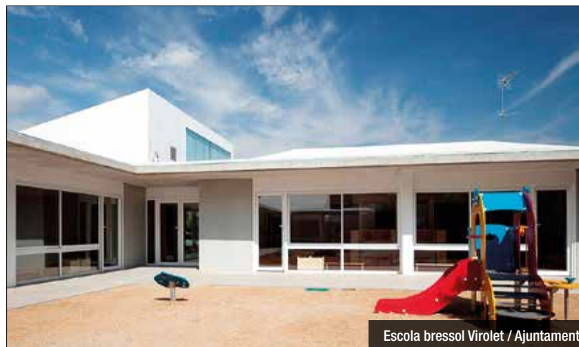
Escola bressol Virolet / Ajuntament

tiu comparteix. Aquest dijous, el Consistori ha anunciat aquesta iniciativa, encaminada a "donar resposta a la creixent demanda de places", ja que, apunten, la situació actual comporta "que una de cada tres sol·licituds de plaça pública no pugui ser atesa". Les zones d'ubicació, a més de Montigalà-la Batllòria, serien els districtes del Centre i de Llefià-La Salut, àrees amb "un dèficit important de places". El pla preveu que cada centre tingui una capacitat màxima de 107 places, repartides en els tres grups d'edat: