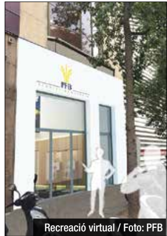
Recreació virtual

PFB-Serveis Funeraris obrirà una oficina d'informació i atenció al centre de Badalona, al Carrer Francesc Layret, 84. L'objectiu d'aquesta nova oficina és la d'informar i acostar els serveis que ofereix Pompas Fúnebres a les famílies, tant en les gestions que tenen a veure amb la preparació, com en les gestions posteriors a la defunció. Des de PFB es mostren convençuts que aquesta nova iniciativa servirà per millorar la informació sobre els serveis que es poden oferir, així com la transparència absoluta en la política de preus, que es pot consultar a la seva pàgina web.