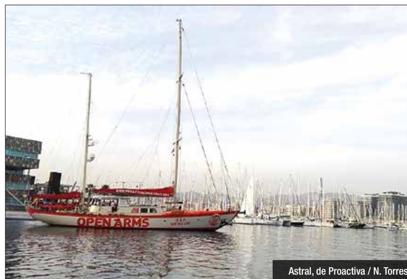
Astral, de Proactiva

s'explicarà la tècnica de la pesca esportiva. La informació detallada està disponible a la web de l'ACPET (www.acpet.es), al Facebook (Marina Day Catalunya), Twitter @MarinaDayCat, #MarinaDaycat i al canal de Facebook i de Twitter del Port @Portde-Badalona. El Marina Day vol trencar amb la imatge que té molta gent de que els ports són llocs tancats i elitistes, i la comunitat del port de Badalona no només s'obre i convida, sinó que acull, des de fa un any, el veler Astral