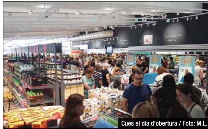
Cues el dia d'obertura

Lidl obre la seva nova superfície al barri de Bufalà aquesta mateixa setmana. La cadena dona el tret de sortida a un ampli espai de venda 1.200 metres quadrats ubicat al carrer de la Filosofia, al solar on fa anys hi havia la discoteca Gran Velvet, tal i com va avançar el Diari de Badalona. Es tracta de la segona botiga ubicada a Badalona, i està pensada, segons la pròpia firma, per aprofitar i conservar energia a través de sistemes d'il·luminació i climatització de baix consum i plaques fotovoltàiques. La inversió