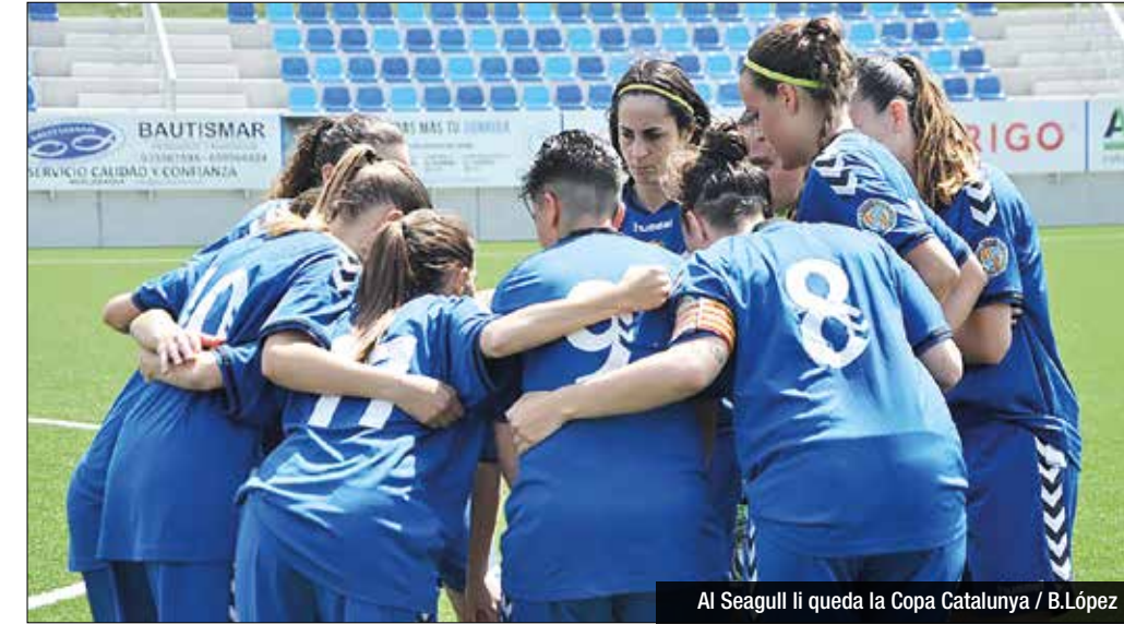
Al Seagull II queda la Copa Catalunya

Al Seagull li arribaven les notícies d'Alacant jugant un partit oficial: concretament la tercera ronda de la Copa Catalunya. Jordi Ferrón no reservaria cap peça per desplaçar-se a territori vallesà, buscant accedir a la següent fase de la competició i mantenir el to per l'últim tram del