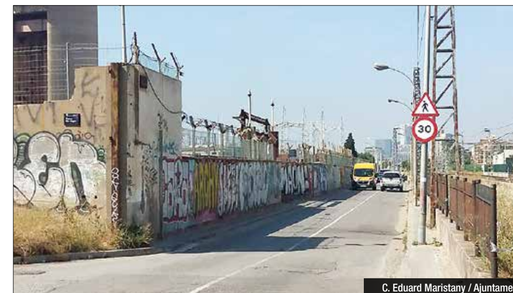
C. Eduard Maristany / Ajuntament

a la cessió del sòl, pas indispensable per a poder impulsar el projecte definitiu per aquell tram de carrer.