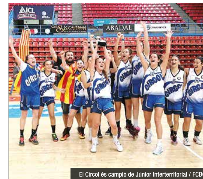
El Círcol és campió de Júnior Interterritorial / FCBO

La Minguella es jugarà el futur a Primera en un tercer partit de màxima tensió a la pista del Reus