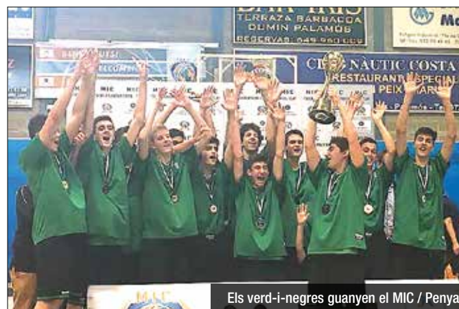
Els verd-i-negres guanyen el MIC / Peña

El Cadet 'A' del Divina Joventut supera el Real Betis davant 1.500 espectadors a Palamós