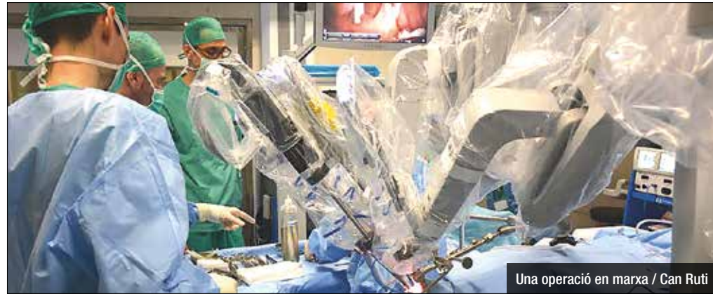
Una operació en marxa / Can Ruti

El nou sistema permet augmentar la precisió i la seguretat. Els professionals que han de dur a terme aquesta cirurgia assistida han rebut una acreditació després d'haver seguit un període de formació indispensable per utilitzar el da Vinci. La cirurgia robòtica aplicada a procediments seleccionats millora els resultats que s'aconsegueixen amb d'altres tipus d'abordatges quirúrgics.