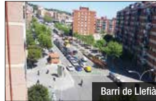
Barri de Llefia

L'Ajuntament de Badalona té previst la reposició al llarg d'aquest any de 179 arbres als carrers i places de la ciutat. Els escocells buits s'ompliran amb espècies que s'adaptin millor a l'entorn. L'objectiu és que en propers exercicis s'acabi arribant a la reposició d'un miler de nous exemplars. Dues de les principals espècies arbòries que es va substituint paulatinament són el Platanus hispanica, el popular plàtan, i el Populus canadensis (l'àlber), tots dos arbres caducifolis i que, en el primer dels casos especialment, el seu pol·len causa problemes d'al·lèrgies entre