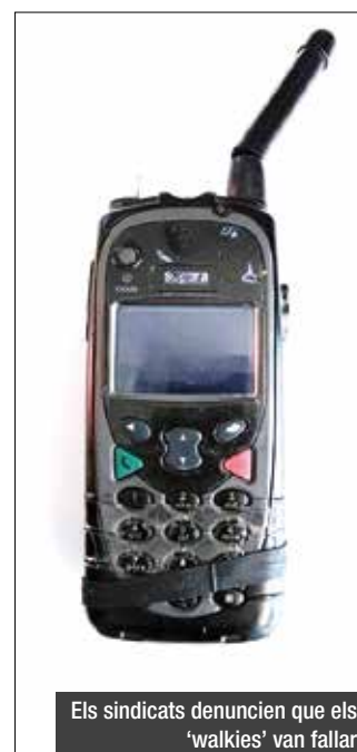
Els sindicats denuncien que els 'walkies' van fallar

Els sindicats critiquen l'estat dels transmissors i convoquen una manifestació