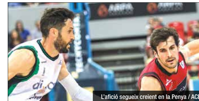
L'afició segueix creient en la Peña / ACB

En una competició d'elit, costa molt trobar un equip que perdi molts partits i que segueixi tenint a l'afició al seu costat. Això li està passant al Divina Seguros Joventut, context que viuria el seu últim capítol en la derrota sumada al Príncipe Felipe. "Al vestidor hi ha un sentiment d'agraïment cap a l'afició. Hi va haver un desplaçament molt gran a Saragossa i crec que el més important va arribar després del partit. Que l'afició t'espera a la sortida del pavelló i et transmeti el missatge