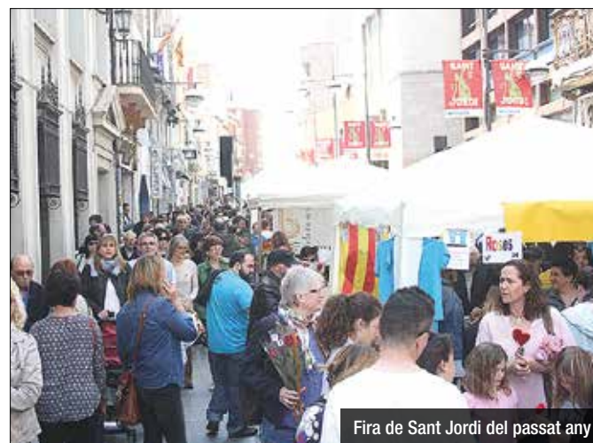
Fira de Sant Jordi del passat any

Prop d'una setantena de parades ocuparan la plaça Pompeu Fabra i el carrer Francesc Layret, que estarà tallat al trànsit durant tota la jornada