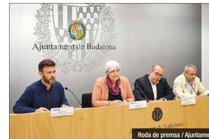
Roda de premsa

paràmetres de la llei perquè sigui acceptada des del Ministeri, que hauria de donar el vistiplau al moviment. La resta del romanent sí es destinaria a pagar interessos i deutes amb entitats financeres, així com altres obligacions.