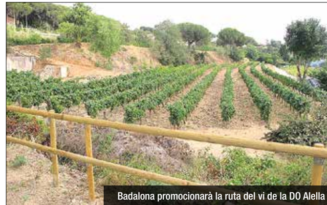
Badalona promocionarà la ruta del vi de la DO Alella

L'Ajuntament promocionarà productes i actes locals