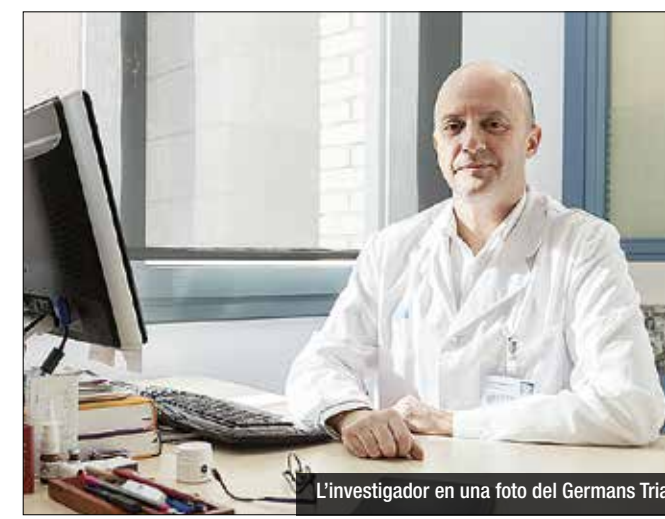
L'investigador en una foto del Germans Trias

Reconegut a nivell internacional, és una peça clau de la investigació contra la malaltia