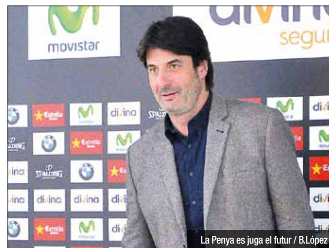
La Penya es juga el futur / B.López

Perquè el Jovenut SAD continuï bategant, s'ha de concretar una tercera i última operació: la venda