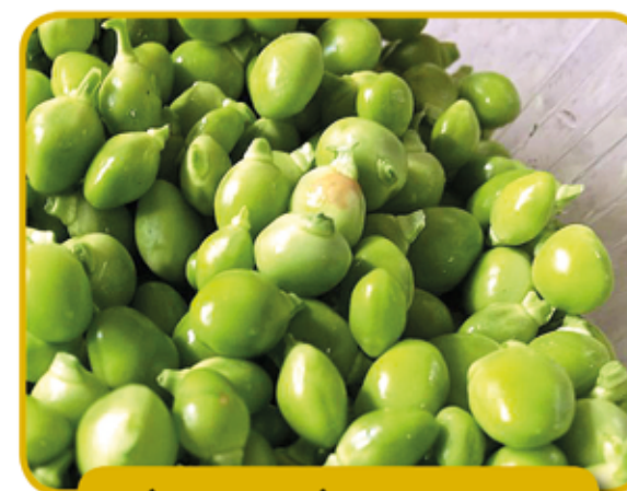
PÈSOL LLÀGRIMA DE LLAVANES