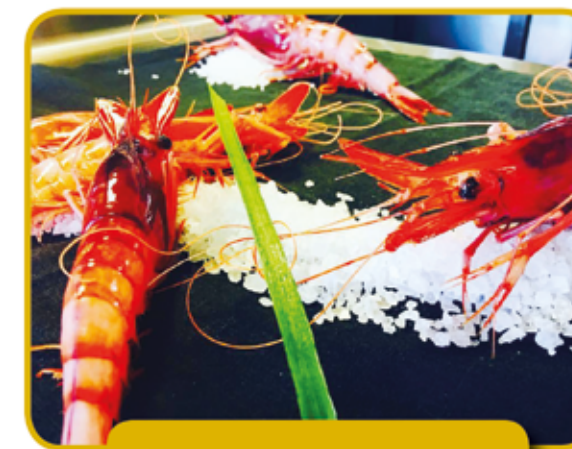
GAMBA VERMELLA DE LA COSTA