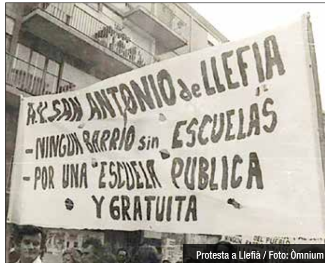
Protesta a Llefià / Foto: Òmnium

Òmnium Cultural va encetar fa unes setmanes la campanya "Lluites Compartides", una iniciativa que vol posar en valor i reconèixer el treball dels moviments veïnals, culturals, socials i educatius per a la construcció no només dels barris, pobles i ciutats