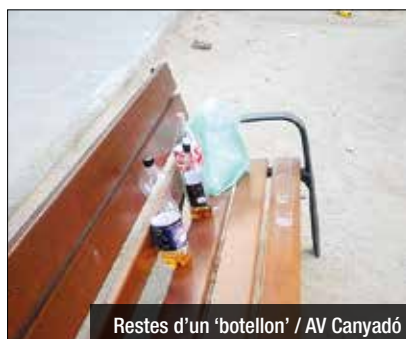
Restes d'un 'botellón'

No és la primera vegada que l'oci nocturn desperta queixes veïnals a l'entorn de Canyadó. Es tracta d'un problema que es remunta a anys enrere però l'afectació de la qual els veïns semblen haver vist augmentar darrerament. Després de sol·licitar solucions a l'Ajuntament en repetides ocasions, l'Associació de Veïns de Canyadó ha acudit al Síndic de Greuges de Catalunya. "Encara no hem aconseguit trobar-nos per tractar el tema i buscar una solució", diuen, en referència a cossos policials i Consistori. Per això, han demanat la "intervenció" del Síndic. "És lamentable l'aspecte que presenten els nostres carrers, també vehicles i mobiliari urbà", que acostumen a ser fruit de l'incivisme derivat del 'botellón', expliquen. A més, alerten que cada cop hi ha més menors d'edat entre els grups que prenen alcohol a la via pública.