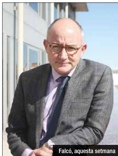
Falcó, aquesta setmana