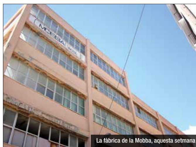
La fàbrica de la Mobba, aquesta setmana

viment, la millora d'il·luminació i posar mobiliari que permeti la dignificació de l'indret i que els veïns i veïnes en puguin fer ús a l'espera de la reurbanització definitiva. De moment, el govern no ha decidit quin serà el futur definitiu de l'espai resultant un cop s'enderroqui l'edifici; ni el cost ni els terminis. A dia d'avui s'està redactant el projecte executiu, que determinarà la despesa i els terminis. Pel que fa a l'ús, la pastilla està qualificada de zona verda.