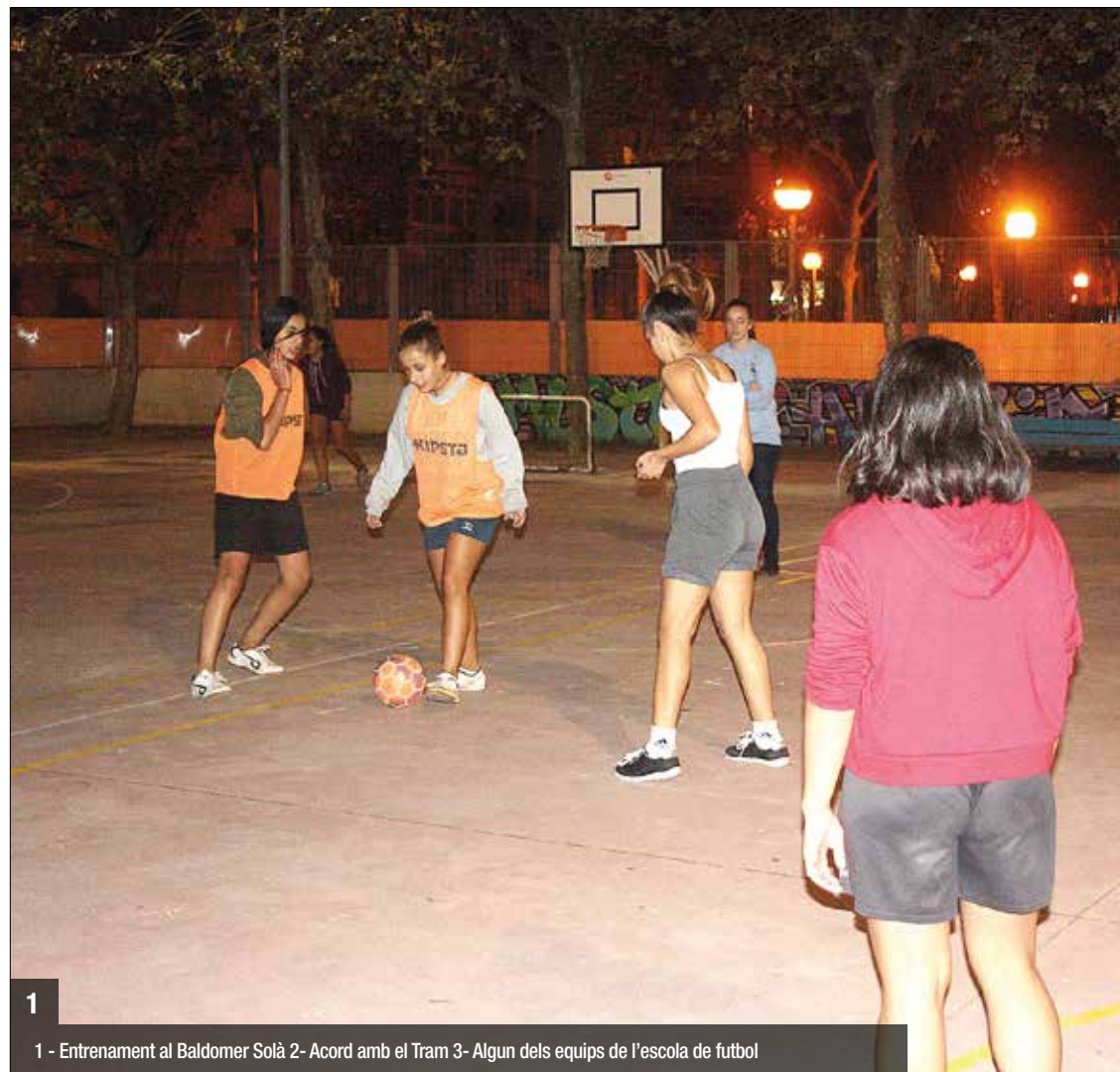
1 - Entrenament al Baldomer Solà 2- Acord amb el Tram 3- Algun dels equips de l'escola de futbol

Seguiment escolar i suport personal L'equip d'entrenadors i coordinadors de l'escola de futbol fan seguiment de l'evolució escolar de les nenes i nens al llarg del curs.