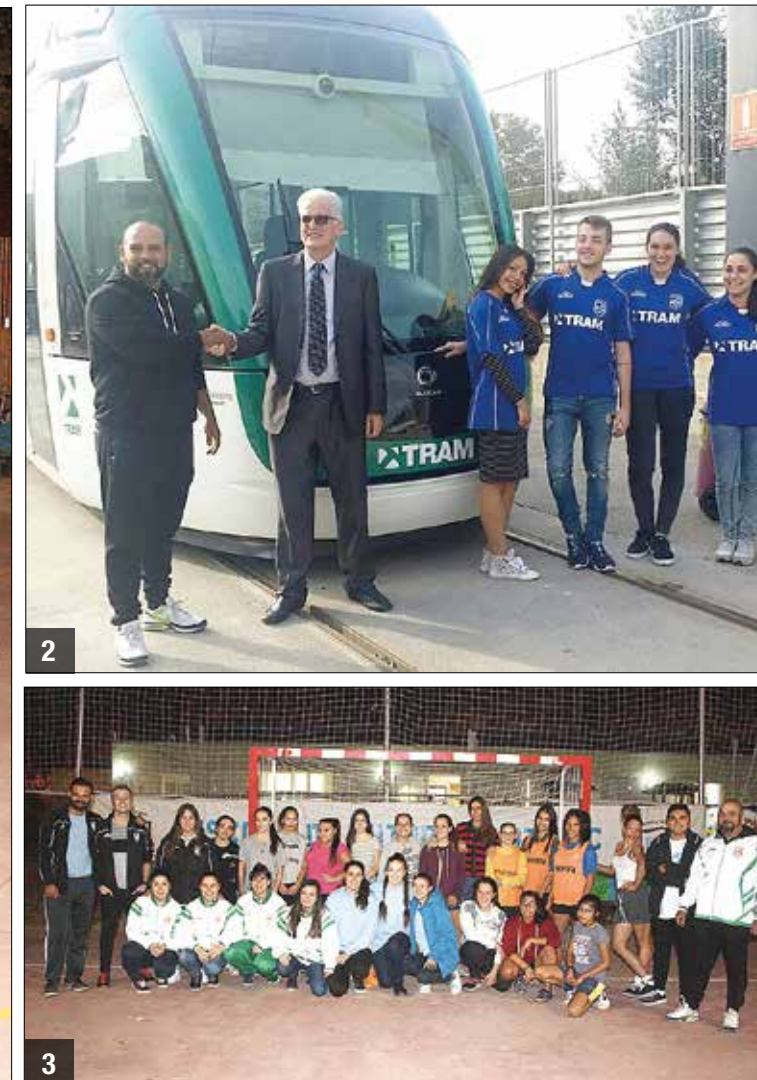
2 - Acord amb el Tram 3- Algun dels equips de l'escola de futbol