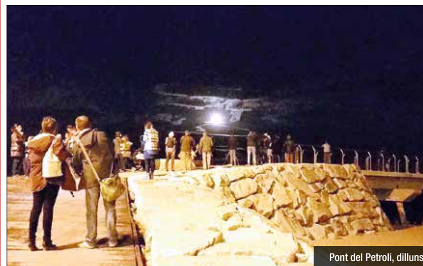
Pont del Petroli, dilluns

daloní i la lluna sortint des de l'horitzó. La costa badalonina va ser un reclam no només per als fotògrafs locals, sinó també d'altres localitats de l'àrea metropolitana que van optar per captar la lluna des del passeig Marítim. Molts fotògrafs es van trobar amb el Pont del Petroli tancat al principi de la tarda i no van poder accedir al pantalà. Des de l'Ajuntament van confirmar que s'havia tancat per previsió de fortes onades i que no tenia relació amb la convocatòria de la superlluna.