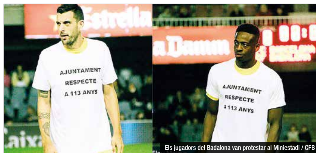
Els jugadors del Badalona van protestar al Miniestadi

A la trobada de dimecres passat, que es va produir a petició del club, van assistir el govern i l'oposició municipal. El Badalona esperava rebre una nova proposta de conveni d'ús de l'estadi, des-