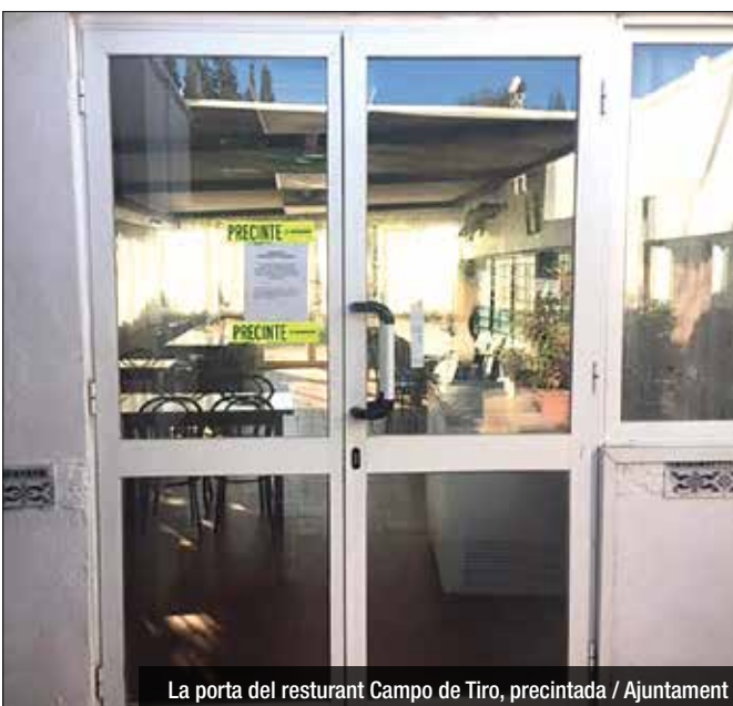
La porta del restaurant Campo de Tiro, precintada

Tot i que podrien reservar-se la possibilitat de presentar recursos, encara no ha quedat clar si optaran per aquesta via. La Guàrdia Urbana es personarà a l'espai un cop acabi el termini, aquest divendres.