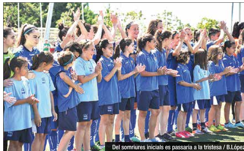
Del somriures inicials es passaria a la tristesa

L'equip de Ferrón promet tornar a intentar l'any vinent l'ascens a la Primera Divisió