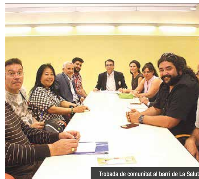
Trobada de comunitat al barri de La Salut

La comunitat pakistanesa "El principal problema és el des-