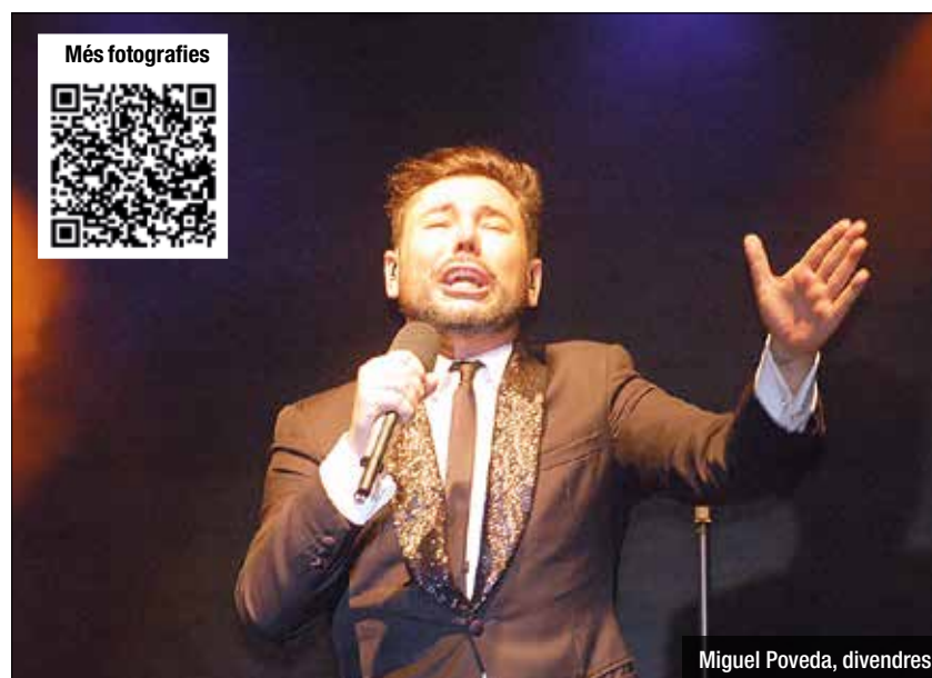
Miguel Poveda, divendres

omplir les graderies de l'amfiteatre del parc del Gran Sol. Davant una previsió d'assistència de públic elevada a aquest concert, a l'exterior s'hi va instal·lar una pantalla gegant per poder seguir la seva actuació. El dissabte va ser el torn del grup Sabor de Gràcia que va comptar amb una assistència de 1.700 persones. El festival el va tancar diumenge Las Migas amb una actuació que va ser seguida per 1.100 persones. L'accés als tres concerts va ser gratuït. La quarta tinenta d'Alcaldia i regidora de l'Àmbit de Badalona Educadora, Laia Sabater, ha ex-