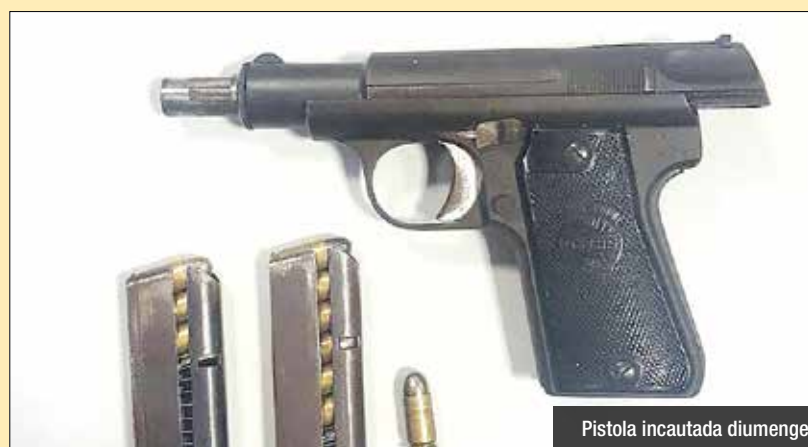
Pistola incautada diumenge

També treball a nivell social i educatiu