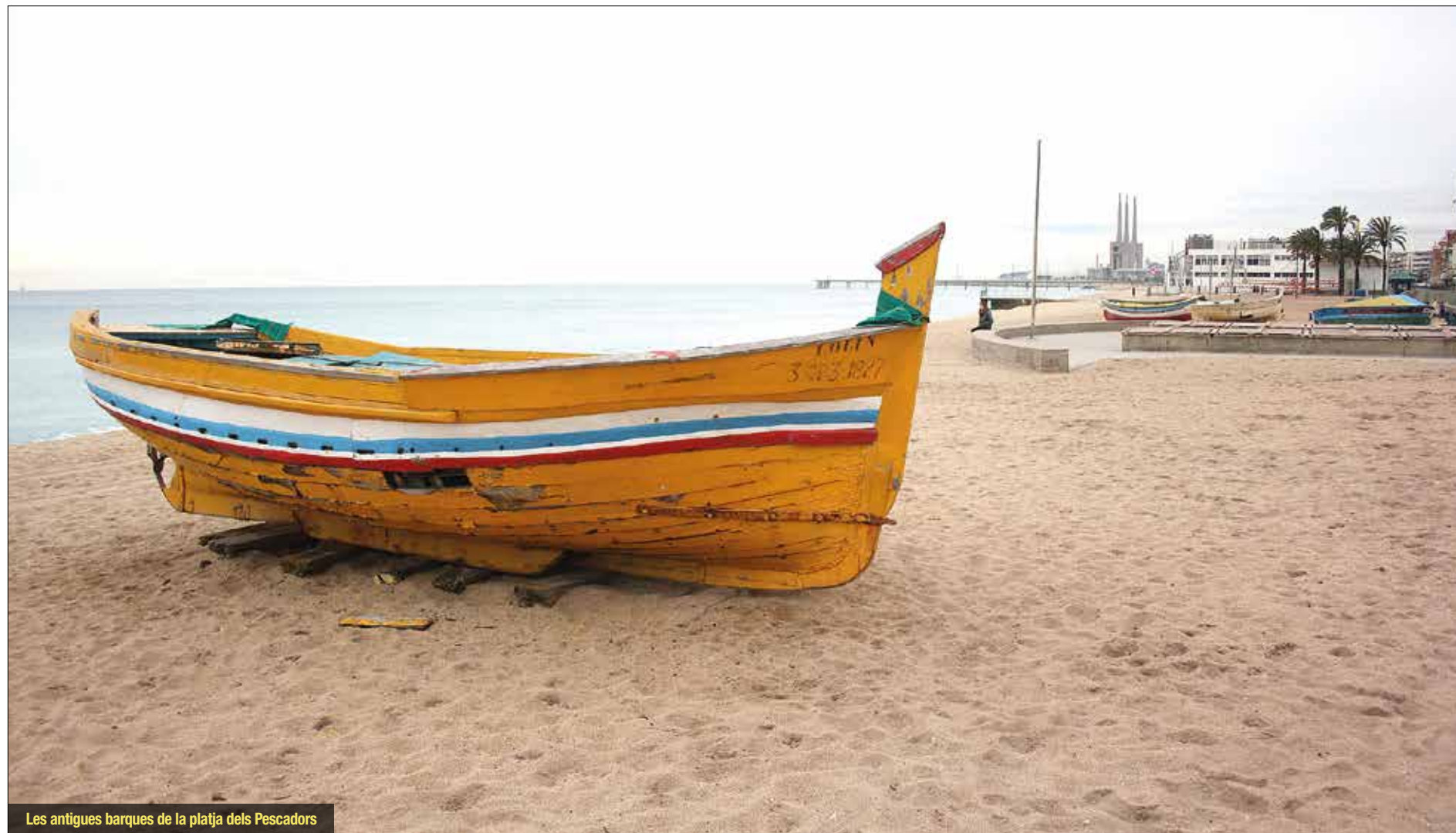
Les antigues barques de la platja dels Pescadors

De les 18 barques existents, quatre són de propietat municipal, pel que cadascuna cos-