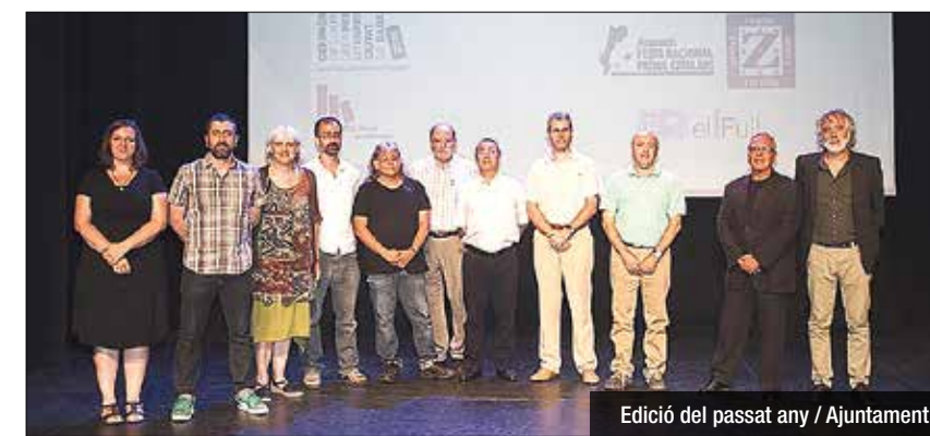
Edició del passat any