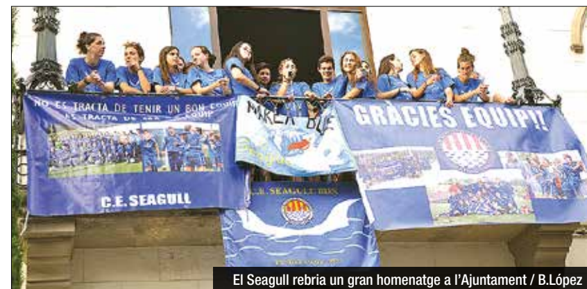
El Seagull rebria un gran homenatge a l'Ajuntament

malgrat lluitar com sempre, les blaves continuarien jugant sense criteri per moure la pilota i anirien perdent l'esperança amb el consum del cronòmetre. Físicament, el desgast de jugadores com Llaona, Mar i Pascu seria heroic i alhora insuficient per remuntar l'eliminària. Mentre Xènia era atesa a la banda després de rebre un fort cop al canell que tenia lesionat, la UD Tacuense aprofitaria la superioritat numèrica per ferir de mort el Seagull. En una ràpida transició, Reichel aprofitaria un mal blocatge de Noe per recollir el refús de la portera badalonina i establir el 0 a 2 final (65). L'última mitja hora de partit es convertiria en un període d'acumulació d'impotència per part local. El