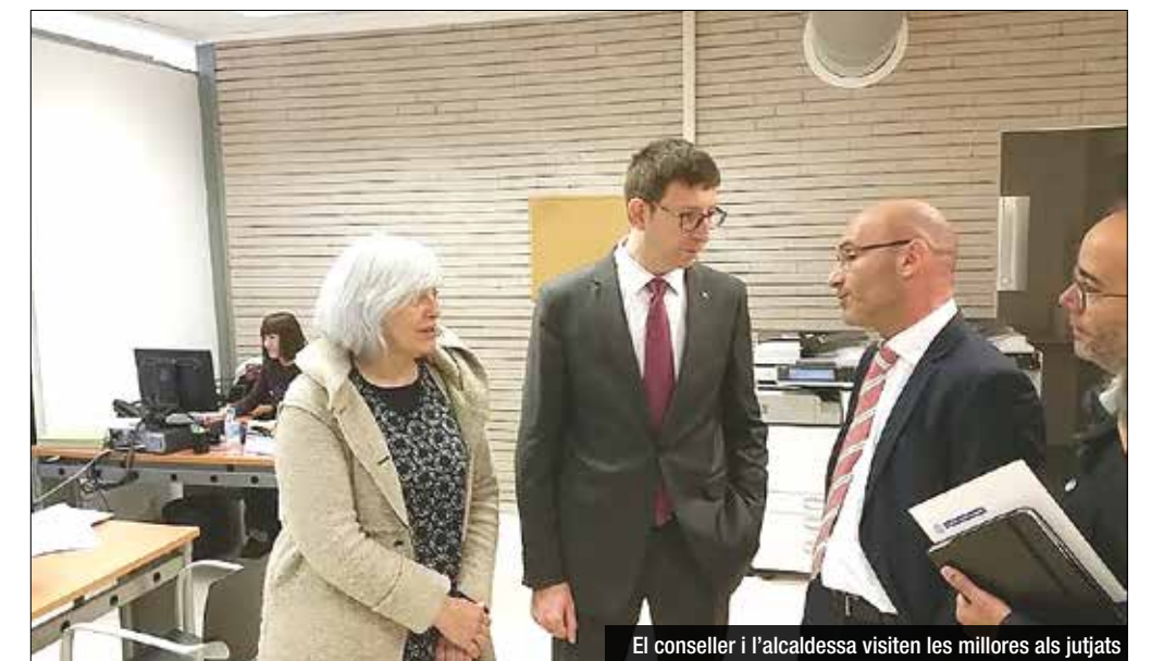
El conseller i l'alcaldessa visiten les millores als jutjats

aquesta tasca en cada torn. Està previst durant l'últim trimestre d'enguany noves actuacions de millora a l'edifici del carrer Prim d'impermeabilització de la teulada i de substitució del sistema de climatització de l'edifici, que suposaran el gruix de la partida, amb 2,3 dels 2,7 milions.