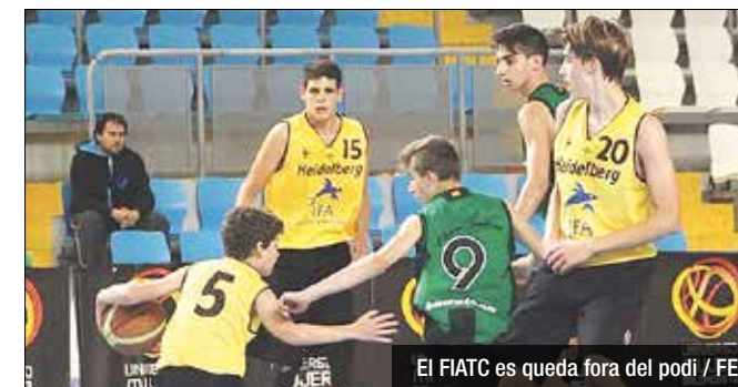
El FIATC es queda fora del podi