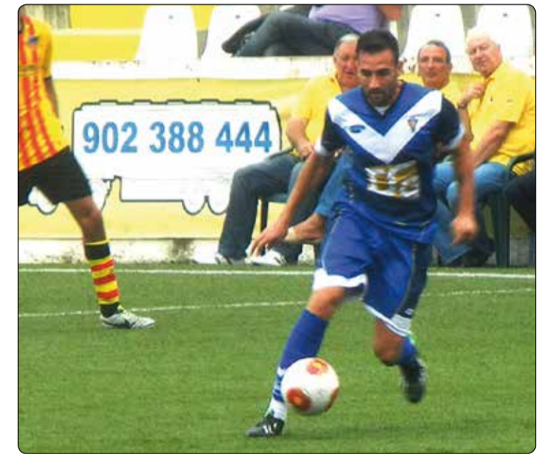
Abraham pot tornar a la titularitat després de la lesió

El Badalona buscarà la primera victòria davant el líder del grup, l'At. Balears